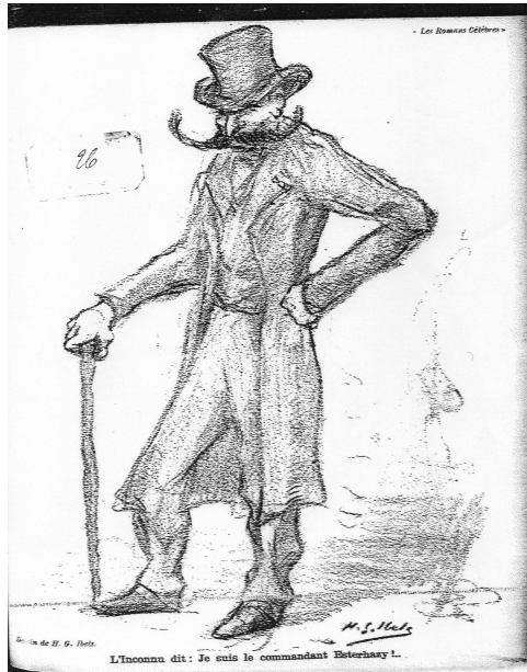
Fig. 5. Henri-Gabriel IBELS. Couverture du Cri de Paris . N°76, 10 juillet 1898.

des fondateurs, travaillent en effet autant pour une « double recherche d'un espace de généralisation juridique et d'extrapolation éthique 30 » que pour la révision de l'erreur judiciaire. Ils sont donc issus majoritairement de milieux universitaires, littéraires ou