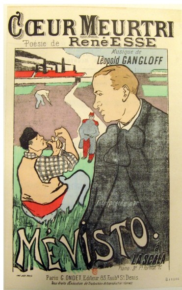
Fig. 1. Henri-Gabriel IBELS. Affiche pour Mévisto : « Le cœur meurtri » à La Scala. 1892. Lithographie en couleurs. 175 x 125 cm. Éditions G. Ondet.

Les demi-cabots vont ainsi devenir le motif privilégié d'Ibels au début de sa carrière ; c'est le cas aussi de Fernand Pelez, dont de nombreux tableaux ont pour sujet les « saltimbanques ». Leur manière est pourtant très différente : là où Pelez réalise des fresques lumineuses glorifiant ces métiers, Ibels préfère une facture bien plus spontanée. Ses illustrations pour le Café-concert , publié par Montorgueil en 1893, croquent les situations banales des salles de spectacles : ses scènes de répétition laissent ainsi entrevoir les coulisses du métier. Ibels cherche en quelque sorte la véracité des conditions de vie et de travail des ouvriers du spectacle, et en cela il est proche de son frère, qui rédige en 1906 La traite des chanteuses , relatant les exploitations dont sont victimes les interprètes féminines des cabarets et cafés-concerts. Dans une même optique, Ibels réalise pour Les demi-cabots 13 des sortes de