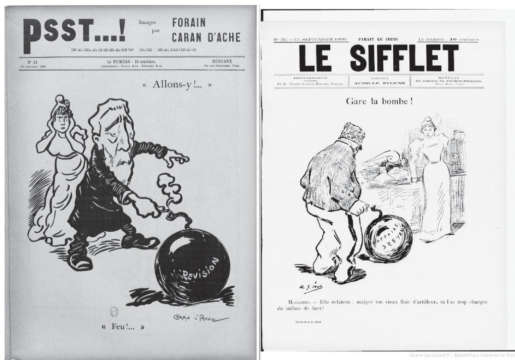
Fig. 6. A gauche : Caran d'Ache. Couverture du Psst...! . N°32, 10 septembre 1898. A droite : Henri-Gabriel IBELS. Couverture du Sifflet . N°33, 15 septembre 1898.

batailles illustrées de l'Affaire, en raison de la similitude de leurs styles, des amitiés passées et de la rapidité des répliques. Leur positionnement en vis-à-vis est pleinement assumée, rendue visible par le choix des titres mêmes. Le Psst...! et le Sifflet font ainsi tous deux échos aux sons produits par les vendeurs de journaux pour attirer le client – l'interjection perd d'ailleurs un peu de son dynamisme avec l'emploi du mot « sifflet ». Elles sont toutes deux composées de quatre pages d'une quarantaine de centimètres de haut pour une trentaine de large tirées en noir, dont trois sont intégralement occupées par des illustrations. Les deux revues sont principalement consacrées à l'actualité de l'Affaire, et s'attachent à rendre leur commentaire simple et rapide de compréhension. Les citations sont ainsi fréquentes, en ce qu'elles permettent de façon aisée de discréditer son adversaire et de corroborer son propre argument. Elles ont de fait été l'objet de nombreuses études, en ce qu'elles permettent de retrouver une chronologie exacte et anecdotique de l'Affaire, et qu'elles rendent compte des possibles renversements d'opinions ou de sympathies.