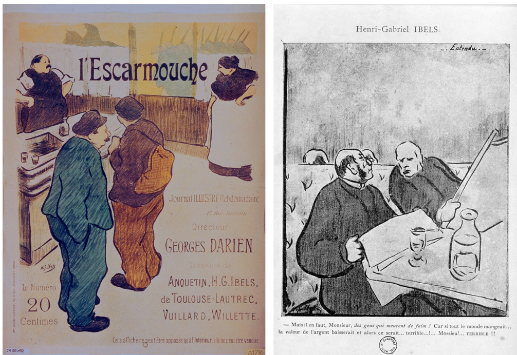
Figure 4 . A gauche : Henri-Gabriel IBELS. Affiche de librairie pour L'Escarmouche . 1893. Lithographie en couleurs. Image : 45,2 x 61,5 cm. Feuille : 50,2 x 65 cm. Imprimerie Eugène Verneau, Paris. A droite : Henri-Gabriel IBELS. Illustration pour La Plume . Numéro 97 « Spécial Anarchie », 1er mai 1893. p.201.