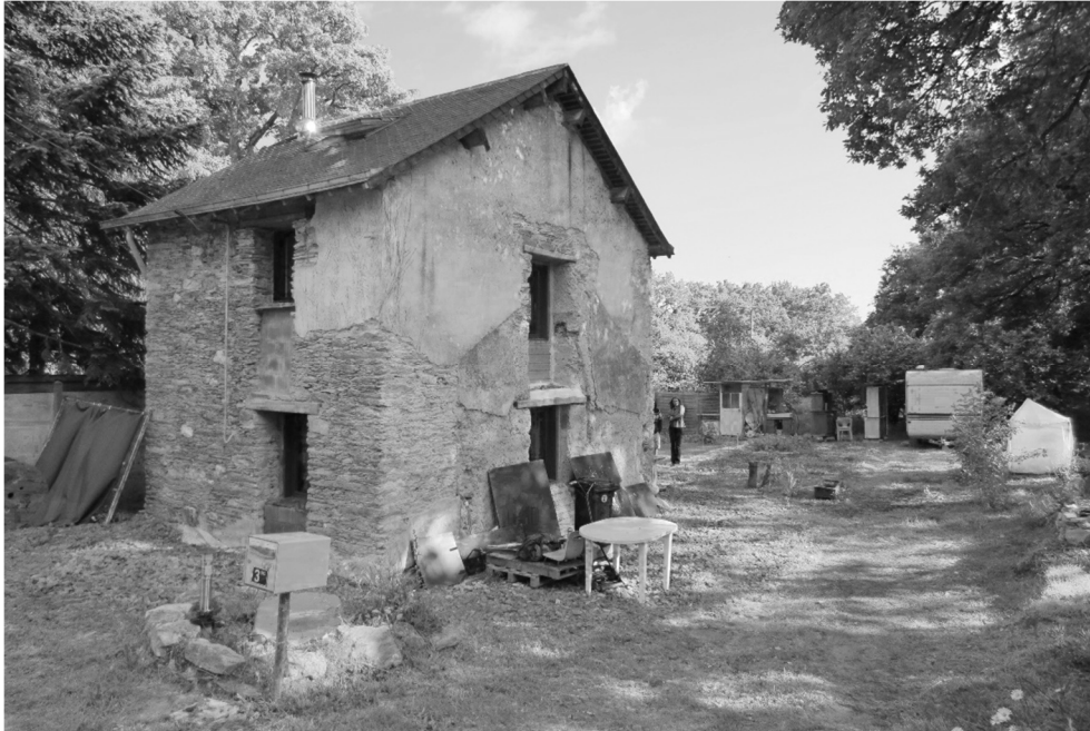
Figure 2. Maison habitée en cours d'auto-réhabilitation. Bien que constituant un critère d'achat pour la maison, le terrain arboré s'est finalement révélé trop occultant pour l'ensoleillement de la pièce de vie au rez-de-chaussée.

Au-delà de l'expérience du chez-soi, les habitants font appel dans leur discours à des situations vécues, plus ou moins récentes, qui justifient également les choix pris ou les futurs aménagements envisagés. En effet, les envies qui portent les projets s'appuient sur des observations remobilisées par les habitants pour prendre des décisions par transposition, même si on peut s'interroger parfois sur la pertinence des comparaisons, négligeant dans certains cas l'impact des modes constructifs ou du climat :