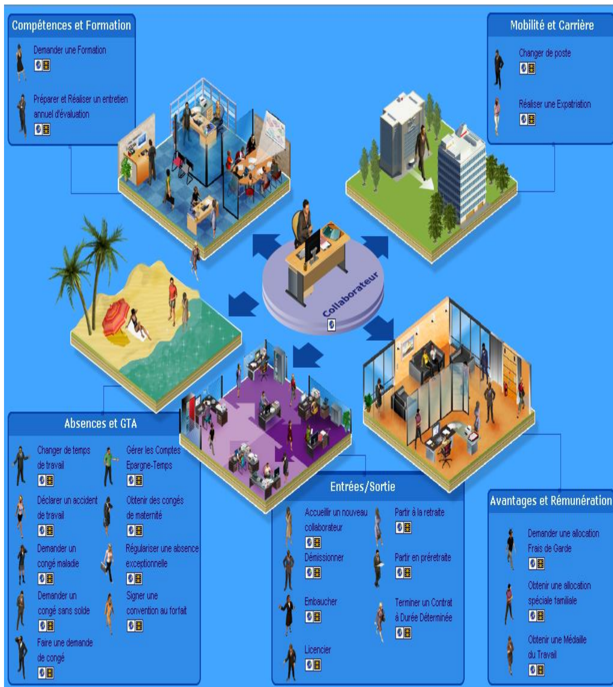
Figure 2 : Exemple de cartographie des compétences

Or l'existence même de cette cartographie ne garantit pas le succès de la démarche de gestion des compétences. Se pose dès lors la question de l'usage de la cartographie et de son appropriation (Lancini, 2001, Markus, 2001, Bourdon, 2004). L'appropriation des TIC par les utilisateurs correspond à l'un des champs de recherche les plus développés dans la littérature des systèmes d'information.