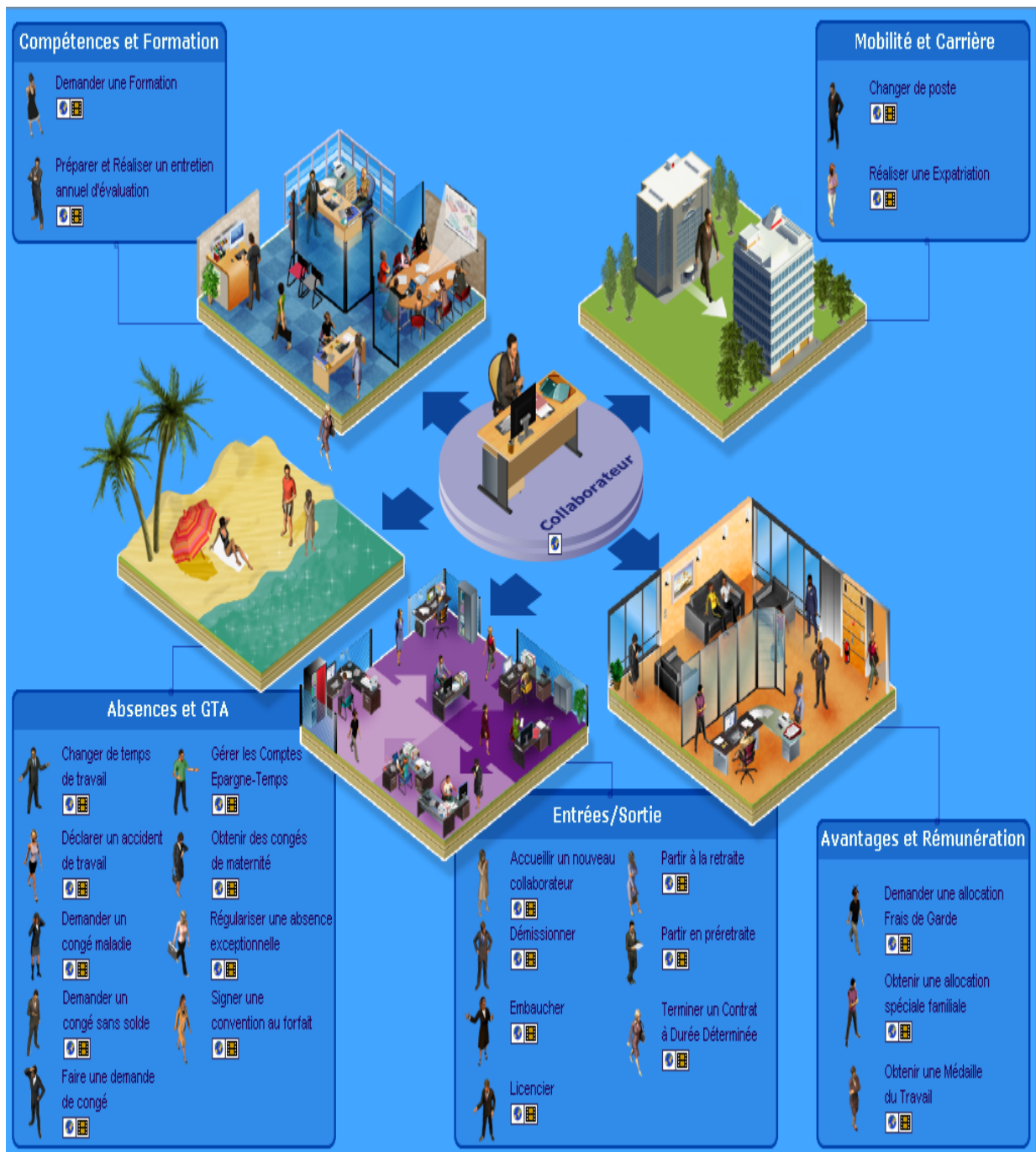
Figure 2 : Exemple de cartographie des compétences

Or l'existence même de cette cartographie ne garantit pas le succès de la démarche de gestion des compétences. Se pose dès lors la question de l'usage de la cartographie et de son appropriation (Lancini, 2001, Markus, 2001, Bourdon, 2004). L'appropriation des TIC par les utilisateurs correspond à l'un des champs de recherche les plus développés dans la littérature des systèmes d'information.