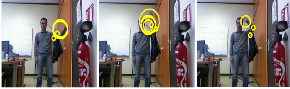
FIGURE 1: Exemple de détection des STIP sur la séquence de geste « Salut ».

sage [11] ( \gamma = \frac{1}{2\sigma^2} ). Dans notre cas nous avons obtenu une valeur de \gamma \simeq 0.1 sur la base d'apprentissage décrite dans la section 4.