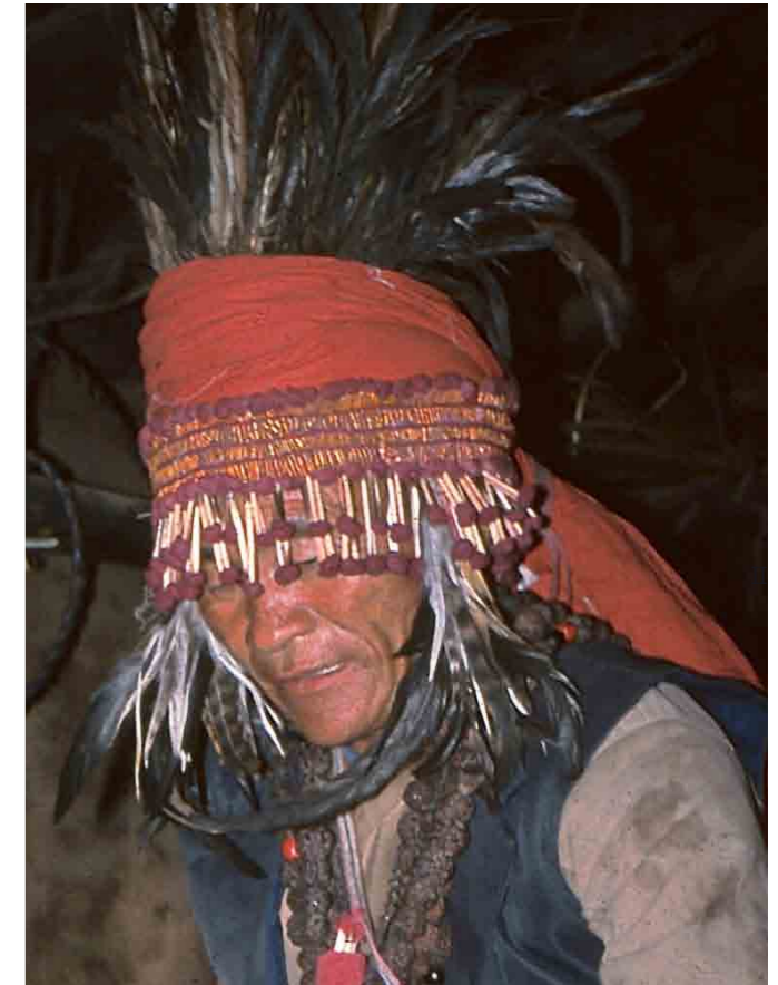
I. Habillage du devin ; on voit clairement la robe blanche, jāmā (N) , cintrée d'un tissu blanc à la taille.

Les coiffes de plumes ( waso ) sont faites d'un ensemble de plumes serrées dans un morceau de métal qui finit en pointe (un devin en possède généralement une dizaine, autant qu'il s'en est confectionné). Si les coiffes sont maintenant composées d'un mélange aléatoire de plumes, il est probable qu'autrefois, chaque coiffe était composée des plumes d'un seul oiseau, car elles sont encore rituellement nommées par le nom de ces oiseaux, comme par exemple « la coiffe du poulet » ( suruwashobotoku ), « la coiffe du faisan » ( towwashokiliwaso ), du paon ou du khelwa (?). On peut penser que ces coiffes renvoient aux capacités volatiles et visionnaires que le devin partage avec les oiseaux, mais ces interprétations ne m'ont jamais été formulées. En revanche, on dit