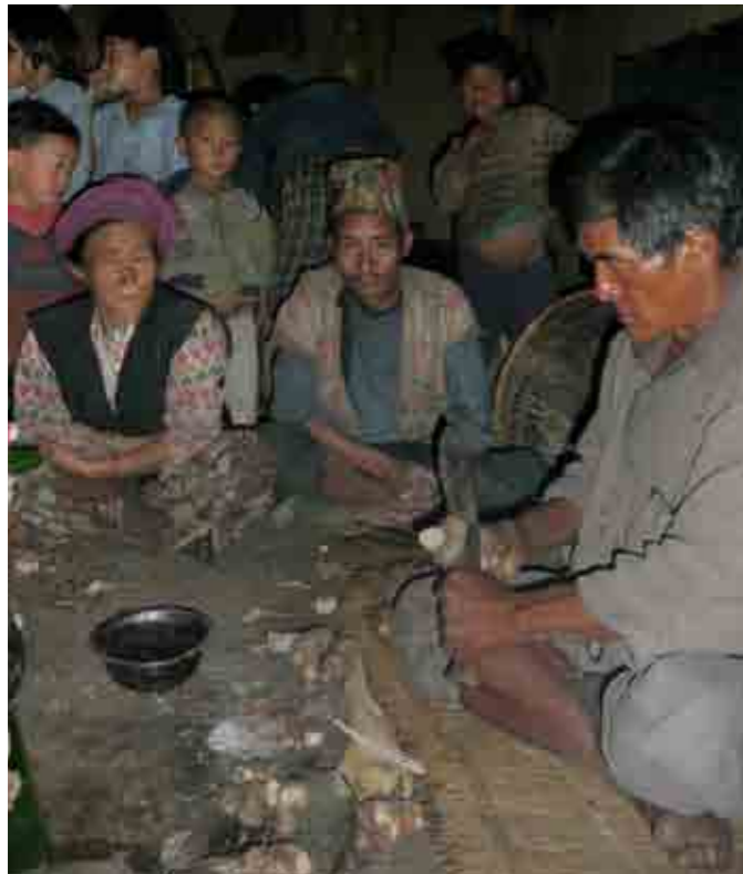
V. Autel mis en place lors d'une séance divinatoire.