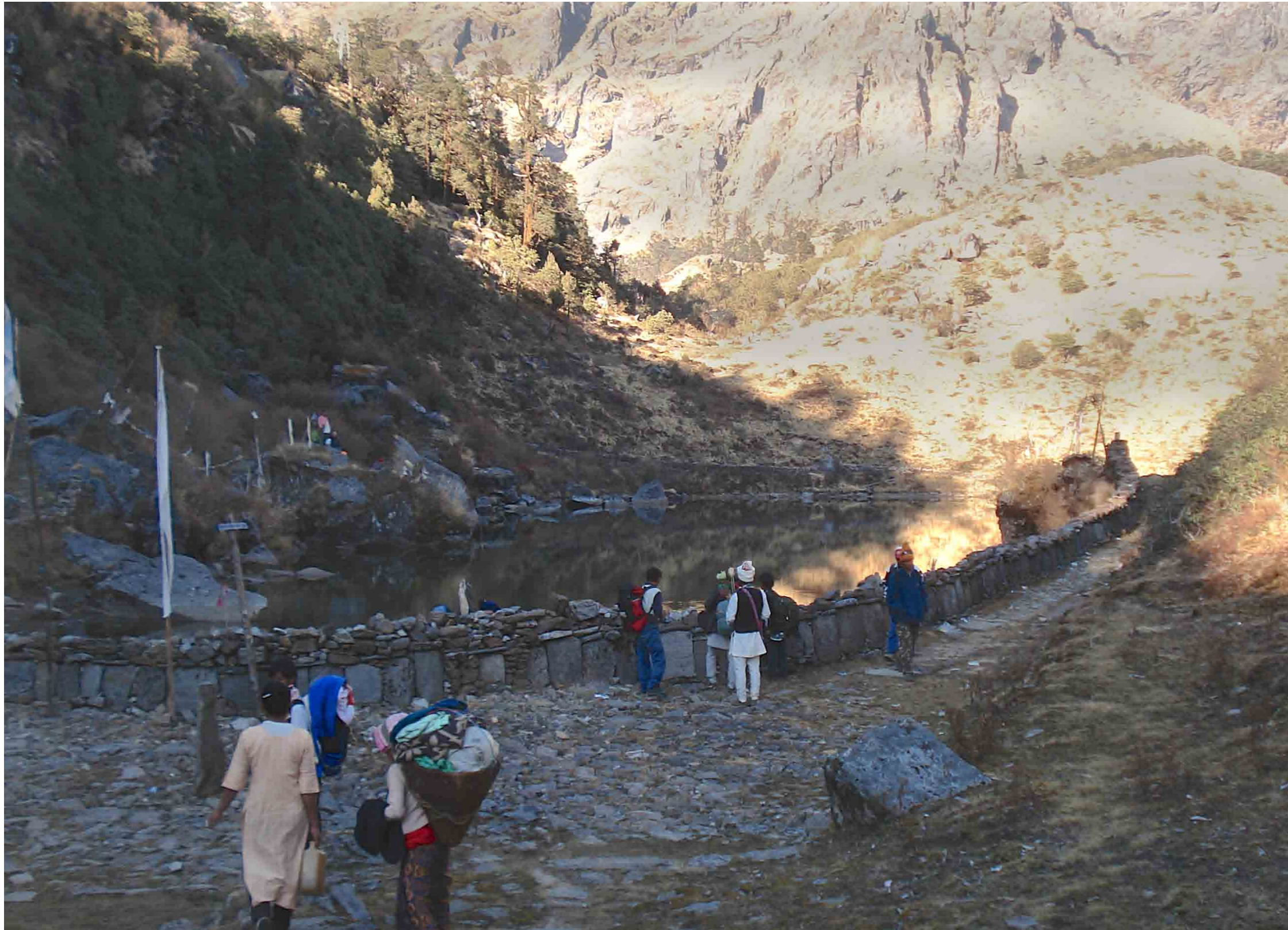
Salpa pokhari, lac de montagne où a lieu annuellement un rassemblement pluriethnique de devins et de fidèles venant honorer la divinité locale.