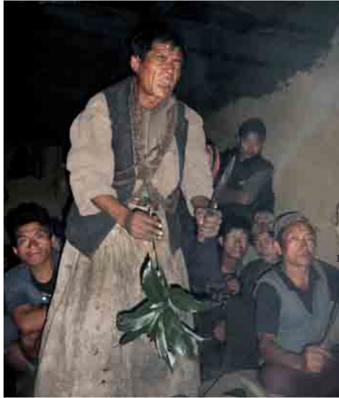
I. Rite d'expulsion de l'esprit d'un mort de malemort.