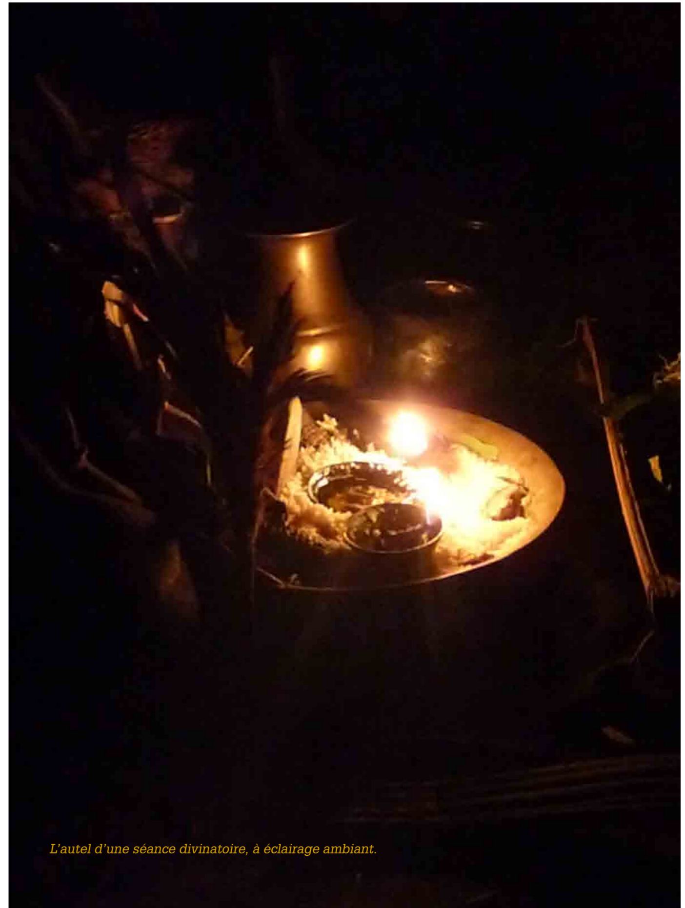
L'autel d'une séance divinaire, à éclairage ambiant.

III. Croquis de l'autel divinatoire (dessin de l'auteur).