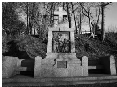
Ill. 2. Monument de l'abbé Miclo à Grosmagny. Photo Alexandra Grevillot 23 février 2004.

Le monument aux morts exprime des sentiments, transmet une mémoire collective. Son expression s'apparente au discours épideictique. Ce genre de discours procède par amplification, il fait ressortir l'importance de ce qu'on dit. Selon Olivier Reboul, « en faisant, par exemple, l'éloge de tel héros, il [le discours épideictique] renforce le sentiment civique et patriotique » (Reboul 1998, p. 58) 6 . Il est persuasif sur le long terme. Il ne dicte pas un choix, mais il oriente les choix futurs. Il est essentiellement pédagogique.