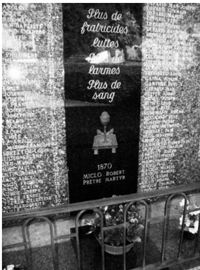
Ill. 5. Monument aux morts d'Orbey. 23 mai 2009.