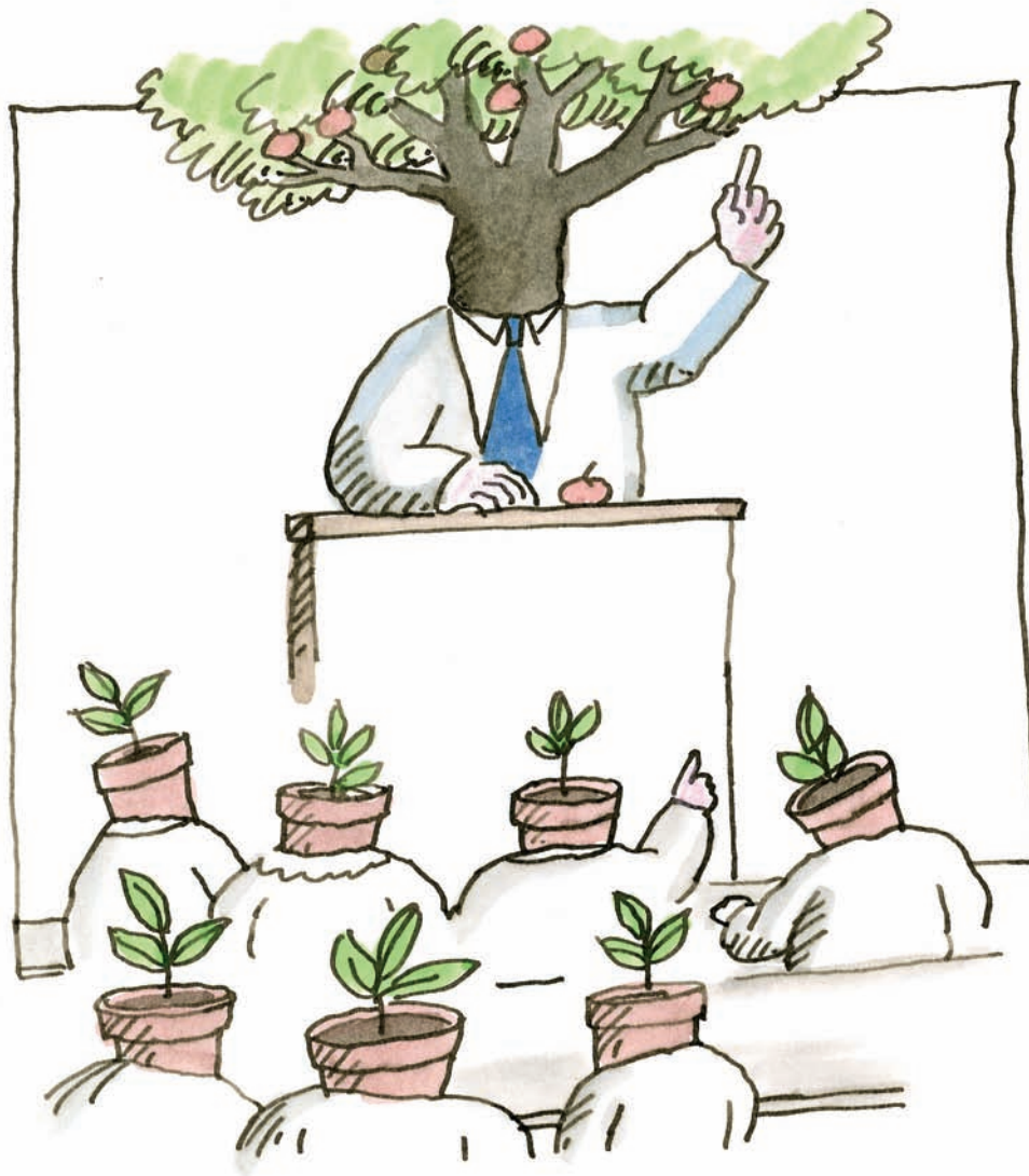
Tomi Ungerer, sans titre [dessin pour Europolitain ], 1999. Encre de Chine et lavis d'encres de couleur sur papier blanc, 29,7 x 21 cm. Collection Musée Tomi Ungerer - Centre international de l'illustration, Strasbourg. © Musées de la Ville de Strasbourg/ Tomi Ungerer. Photo: Musées de la Ville de Strasbourg.