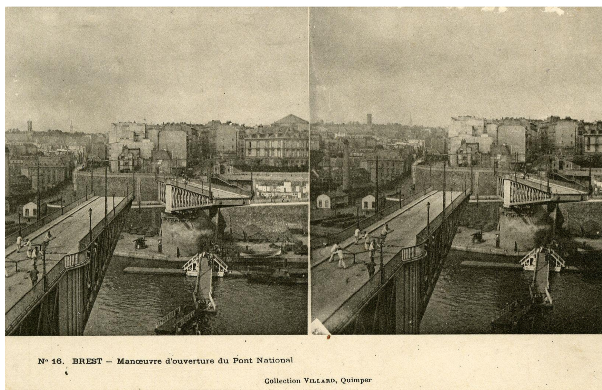
N° 16. BREST - Manoeuvre d'ouverture du Pont National