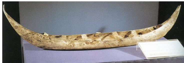
Modèle en argent, tombe de Meskalamdug trouvé dans le cimetière de la ville d'Ur dans le Sud de la Mésopotamie, avec d'autres modèles (env. 2600-2500 av. J.-Chr.)

Modéliser en 3D statique et cinématique des objets ou des machines