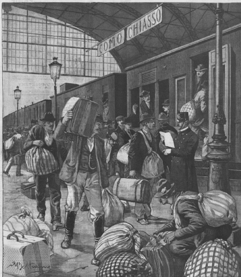
LA SINGOLARE EMIGRAZIONE DI QUESTI DI: L'ARRIVO E LA PARTENZA DEGLI EMIGRANTI MERIDIONALI DALLA STAZIONE DI MILANO PER IL CANADA. (Disegno dal vero, di A. Beltrame).