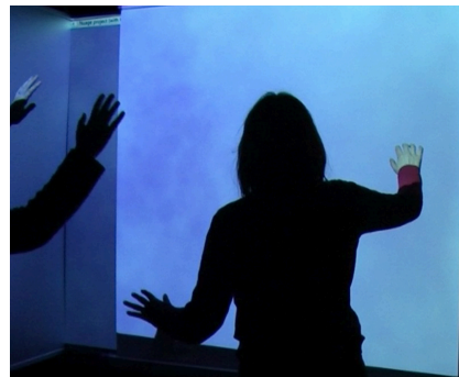
Almost Blue , RêvA