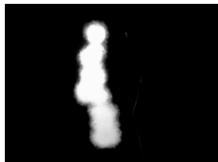
Walking clouds , RêvA