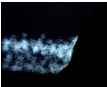
Figure 2. Walking clouds , RêvA (© n.delprat)

comme si la projection du corps 11 dans le nuage virtuel emportait une partie d'elles-même et bouleversait leur espace corporel. Si ce vécu dépend pour un même utilisateur du type de nuage testé, l'adhésion imaginative liée à la dimension poétique du nuage semble dans tous les cas en être un élément essentiel. En effet, plus le sujet s'implique imaginativement dans le jeu de la Rêverie Augmentée moins il se sent débordé « intérieurement » par lui. Enfin, plusieurs personnes ont exprimé un prolongement des effets (positifs ou négatifs) de l'expérience pendant l'entretien qui a suivi la séquence de test. L'étude de cet impact différé fait partie des objectifs du prochain protocole.