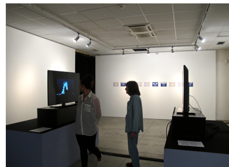
Espace Van Gogh, Arles, 2014