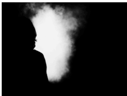
Figure 1. Avatar-stratus (gauche) et avatar-cumulus