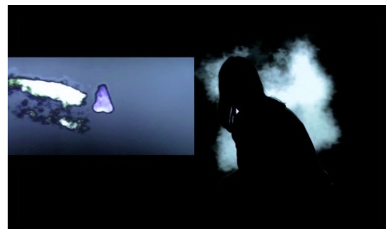
vidéo 5'17", 2014

Le temps réglé de la projection place celui qui regarde dans le tempo lent de la matière-nuage laissant la trace d'un moment de sérénité, d'une parenthèse étirée. Les personnes évoquent toujours un sentiment de fluidité, d'accord émotionnel avec les qualités de la matière même si l'impact cognitif est bien entendu moins fort que dans le dispositif. Ce qui est nouveau, c'est