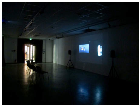
Figure 3. ECHO(S) et ECHO(S)II

de manière collaborative pour créer un ciel presque bleu. Avec l'effet de zoom, il suffit qu'un seul des participants bouge légèrement pour que le ressenti corporel des deux soit transformé. Cette interaction indirecte n'a pas encore été analysée dans un protocole dédié mais elle pose le problème complexe de l'accord de deux personnes par synchronicité des mouvements et concordance gestuelle 12 , avec un possible effet miroir à travers la co-création dynamique du rendu 13 . La mise en mots du vécu de cette expérience, comme celle où l'on est seul, n'est pas facile à faire car on peut manquer d'analogies ou de métaphores pour décrire précisément un retour sensoriel parfois fugace ou diffus. Sa verbalisation pendant la séquence de tests n'a d'ailleurs pas été retenue car elle entrave le lien avec l'avatar et gêne la concentration sur les sensations corporelles. Par contre, il est possible de changer de point de vue et de s'intéresser pendant l'expérience au ressenti d'un sujet spectateur dans le contexte des configurations précédentes ou d'une projection/installation vidéo que j'ai réalisée en 2014. Cette troisième configuration ( ECHO(S) et ECHO(S)II ), qui s'inscrit dans le prolongement artistique de ces recherches, a été présentée dans le cadre d'un festival 14 et sera testée dans d'autres lieux afin de constituer une base de données sur le retour d'un regard extérieur. Les problématiques particulières qu'elle soulève sont décrites dans le paragraphe qui suit.