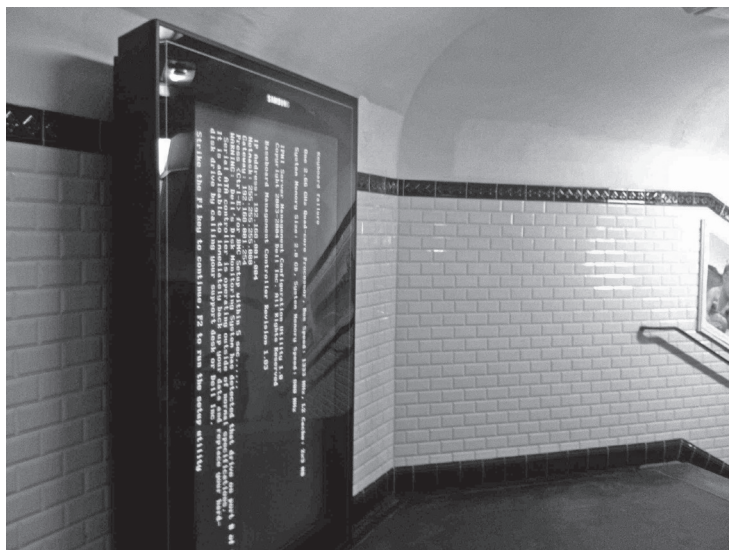
Photographie 1 - Panne d'écran, Paris, métro, 2011

La panne génère une inscription qui, si elle constitue une écriture (elle reste linguistique et lisible) manifeste de plusieurs manières le dysfonctionnement.