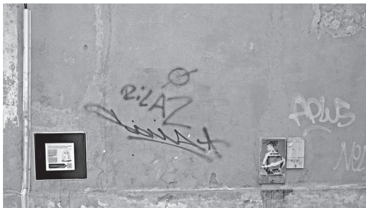
Photographie 3 - Tabaluz, Rue des Arènes, Arles, juillet 2012

Nous nous intéresserons plus particulièrement à l'intégration des objets d'affichage que sont les tabaluz dans l'économie scripturaire d'un mur, en situation : mis en scène pour le dossier de presse dans une image qui accentue le contraste entre la lumière bleue du (faux) écran, moins spectaculaire dans la photographie de jour prise par nous.