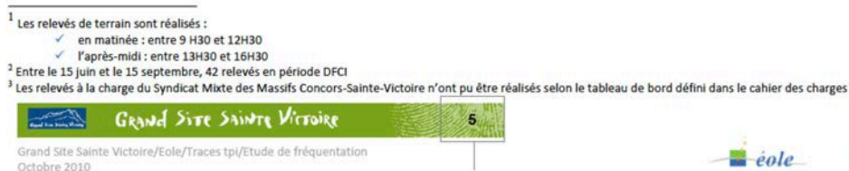
Figure 14. Nombre de relevés mensuels pendant la période d'étude