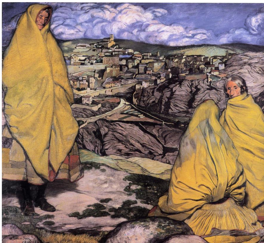
fig. 15.- IGNACIO ZULOAGA, Femmes de Sepúlveda , 1909, 182 x 213 cm, Mairie d'Irún, Guipuzcoa.

Nous voilà bien avancée. Dans le portrait d'Azorín, le paysage du fond ne serait-il qu'un caprice de Zuloaga, l'expression de sa manière? Et Azorín dans tout cela?