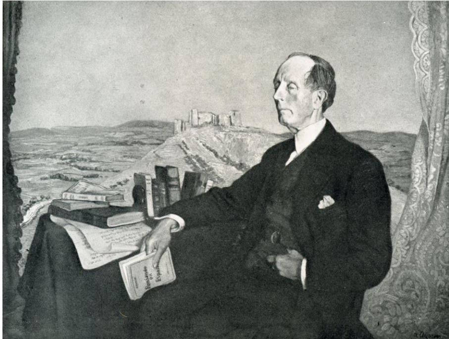
fig. 14.- IGNACIO ZULOAGA, Portrait de José Martínez Ruiz, «Azorín» , 1941, Madrid, Collection particulière.

analogique—, à la différence du portrait littéraire qui requiert une abstraction mentale, le langage étant fait de signes littéralement abstraits par rapport à ce qu'ils désignent.