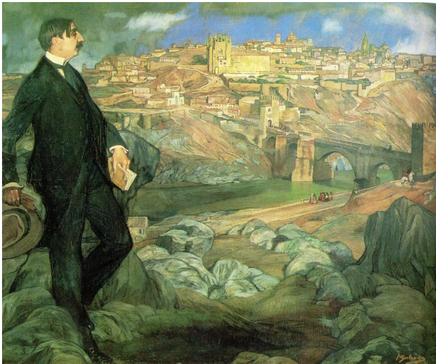
fig. 16.- IGNACIO ZULOAGA, Portrait de Maurice Barrés , 1913, 203 x 240 cm, Paris, Musée national d'Art moderne, Centre Georges Pompidou.

présent derrière lui a un degré de fictionnalité plus élevé, puisqu'il est représentation fruit d'une représentation, étant le produit de la figure d'Azorín peinte dans le tableau. L'on est tentée de déduire, en observant le processus induit par le tableau et en repensant aux caractéristiques esthétiques d'Azorín et de Zuloaga, que ce que l'on nous donne à voir, ce n'est pas tant un paysage dont le référent serait la nature, qu'un paysage dont le référent est déjà une représentation, qu'elle soit littéraire ou picturale, qu'elle appartienne à Azorín ou à Zuloaga. Nous disons à Azorín ou à Zuloaga, car le Portrait d'Azorín étant à la fois matérialisation du processus créatif et reprise explicite de la «maniera de Zuloaga», la translation nous conduisant de l'acte créateur d'Azorín à l'acte créateur de Zuloaga n'en est que plus aisée, le Portrait d'Azorín devenant paradigmatique de l'activité créatrice. Ce paradigme, ce modèle reproductible sous-jacent à l'œuvre l'extrait des strictes contingences, et nous autorise à résumer la fiction du tableau par cette phrase simple: «Zuloaga a représenté le processus de création». Mais il manque encore à confirmer le dernier point de notre hypothèse selon lequel ce processus de création se redouble –la création ayant pour référent une représentation– pour retrouver la petite histoire mise en scène par le tableau.