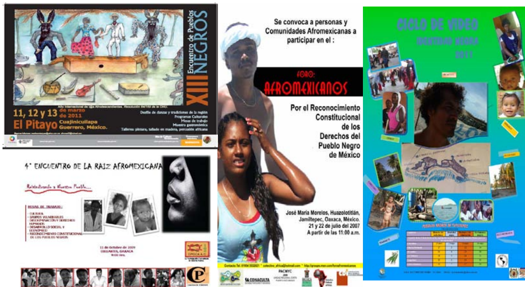
Figura 2. Afiches de eventos que visibilizan el tema afro al interior de la región de la Costa Chica

Hoy, los líderes y los colectivos sociales y políticos de la Costa Chica, algunos ya trabajando el tema afro desde hace muchos años y otros más recientemente, tienden a recurrir a este "instrumento" (la etnización) para elaborar a su vez discursos propios y descartar otros, y participar por esta vía a la construcción "colectiva" pero diferenciada de