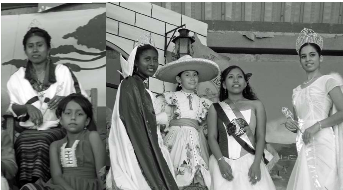
Figura 5: Fiesta Patria en Pinotepa Nacional, Oaxaca. Las Reinas Indígena, Negra, Charra, Fiestas Patrias y América (de derecha a izquierda respectivamente).

En México, uno de los efectos de estos procesos de transnacionalización vía externalización de la temática afro es la modificación del escenario político que empieza a integrar esta dimensión identitaria en su repertorio. Se ve particularmente en momentos electorales, como lo vimos al estudiar las dinámicas políticas en la Costa Chica de Oaxaca (Lara 2008). Los partidos políticos con mayor presencia política como el PRI y el PRD (Partido de la Revolución Democrática) buscan electores utilizando registros identitarios locales: uno enfatiza su lucha en contra de la discriminación histórica de que ha sido víctima la región y su población, el otro valora la cercanía cultural de su candidato con las comunidades indígenas y afroestizas, pero en ambos casos su argumentación electoral se refiere a una diferencia del electorado basada en su pertenencia a un supuesto colectivo “afro”. Estos nuevos discursos traen consigo nuevas ritualidades cívicas donde se representa el elemento afro. Tenemos así el ejemplo de las Reinas de las fiestas patrias que recientemente incorporaron a la “Reina Negra” al lado de las tradicionales Reinas indígena, charra y de América, como en el caso del desfile en Pinotepa Nacional, uno de los pueblos política y económicamente más importantes de la región (figura 5).