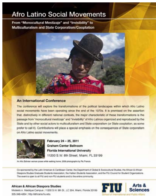
Figura 3: dos eventos recientes organizados por la Florida International University en 2011 y por la UNAM en 2009, respectivamente