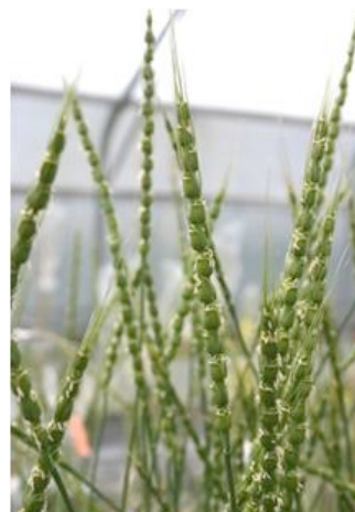
Figure 1 : Epis d' Ae. tauschii

Ae. tauschii a une distribution géographique très vaste qui s'étend de la Turquie à l'ouest de la Chine. Cette zone est très diversifiée d'un point de vue climatique et pédologique.