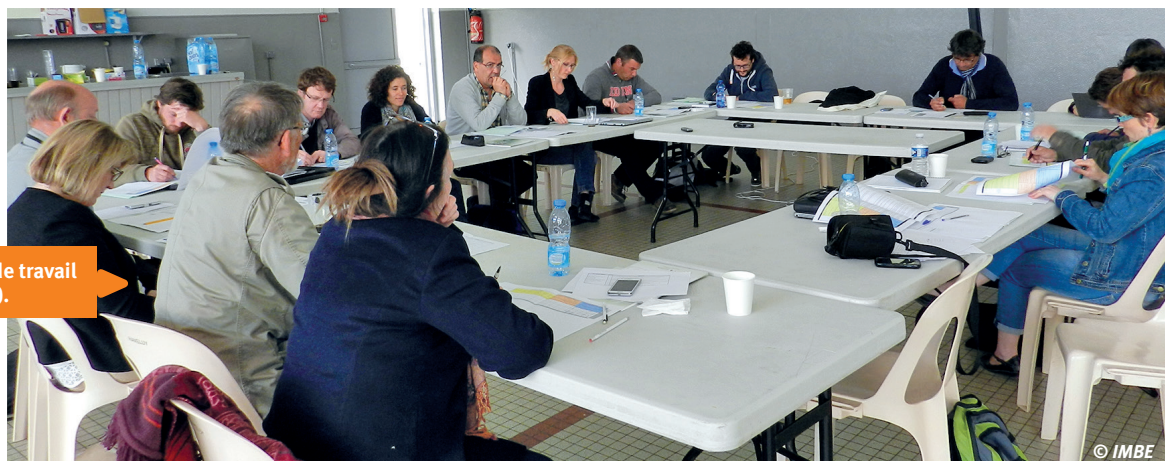
1 Atelier de travail (juin 2015).