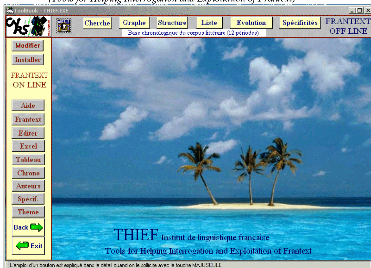
Figure 3. Le menu du logiciel THIEF (Tools for Helping Interrogation and Exploitation of Frantext)

Pour garder à notre propos un peu d'unité, au moins l'unité de lieu, et retrouver la thématique du début de notre exposé, choisissons pour exemple des noms de lieu, en l'occurrence les toponymes les plus connus, soit 130 au total. Distinguons les écrivains, afin de savoir à qui attribuer les préférences ou les rejets. Et constituons un vaste tableau de 130 lignes et de 31 colonnes (on a choisi 31 écrivains du XVIIIe au XXe siècle et proposé la liste à Frantext pour chacun de ces écrivains). L'analyse factorielle que reproduit la figure 4 et que THIEF a réalisée donne une image de cette géographie mentale que projette l'usage des écrivains.