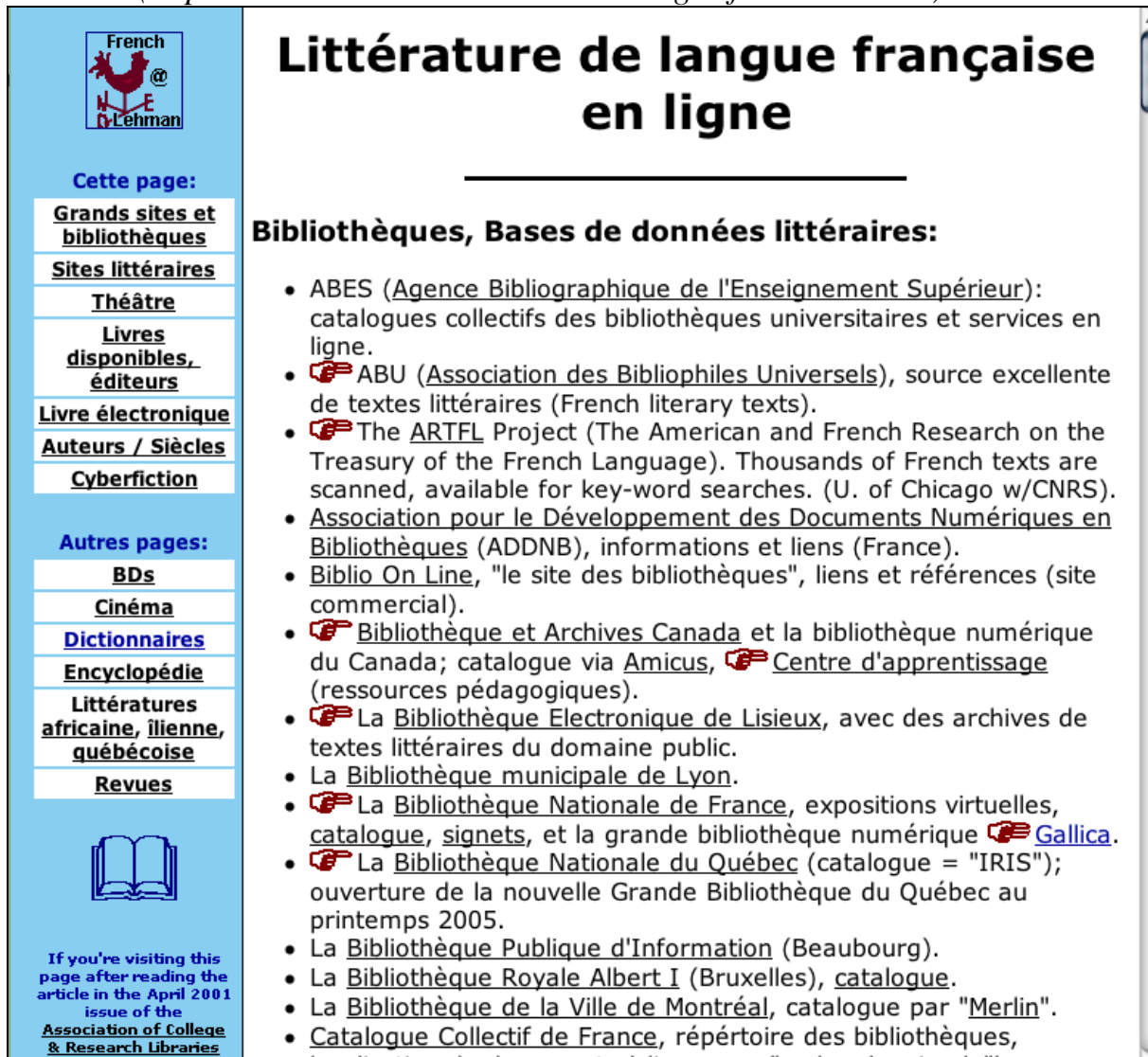
Tableau 2. Extrait du panorama des ressources linguistiques française ( http://www.lehman.edu/deanhum/langlit/french/lit.html )

Certes cette attente ne vise guère à la satisfaction de besoins utilitaires. Elle se mêle à d'autres aspirations que la France polarise pareillement : au goût du luxe, des parfums, des vins fins, de la haute couture et de la haute cuisine. Les amateurs de haut langage se tournent ainsi vers la France, comme jadis les romains cultivés vers la Grèce. Ils lui savent gré de garder une langue pure, peu accueillante aux emprunts et aux réformes et jalouse de ses subtilités, de ses conjugaisons et de ses difficultés, estimant que l'usage généralisé de l'anglais dans les affaires ne peut qu'abaisser cette langue à un rôle de truchement commercial et l'entraîner à la trivialité et à la déchéance.