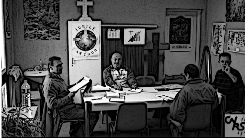
Image 3 -Placement des participants.

La séquence interactionnelle identifiée correspond au second démarrage de l'activité. En effet, l'enseignant demande une première fois au chercheur de couper la caméra afin de se mettre d'accord avec les participants sur le déroulement de la séance.