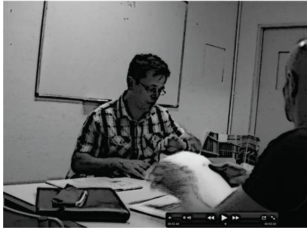
Image 4 - Placement des participants.

de l'activité lorsque l'enseignant précise la durée du cours et indique à l'étudiant, placé dos à la caméra, que le cours devra être interrompu plus tôt. Cette digression dans l'emploi du temps habituel est justifiée par la présence du chercheur et l'installation du matériel pour l'enregistrement de la prochaine activité pédagogique.