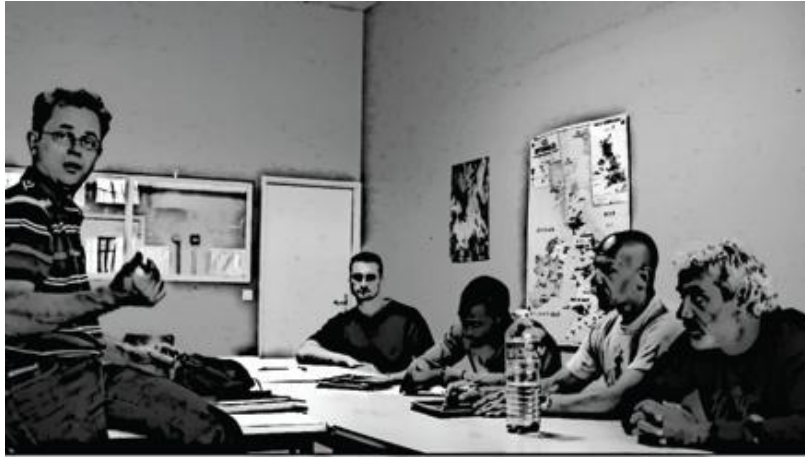
Image2- Prise en compte du dispositif d'enregistrement.

élucide. L'étudiant dans le coin droit de l'image regarde d'abord dans une direction hors champ puis en direction de la caméra (Etu1) ; à sa droite l'étudiant regarde l'enseignant (Etu2) ; à côté de lui, un autre étudiant (Etu3) écrit sur une feuille posée devant lui et enfin, l'orientation du dernier (Etu4) prend en compte le groupe, l'enseignant et se rend visible à la caméra.