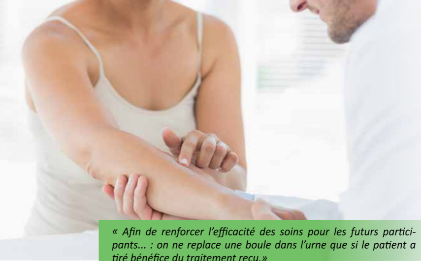
« Afin de renforcer l'efficacité des soins pour les futurs participants... : on ne replace une boule dans l'urne que si le patient a tiré bénéfique du traitement reçu. »

nellement au nombre de fois où elle a été tirée. Ces modèles aléatoires trouvent de nombreuses applications concrètes. L'urne de Polya peut être ainsi utilisée comme un modèle économique de l'évolution au cours du temps de l'affrontement entre deux standards : les boules représentent des clients et la couleur associée désigne le standard qui a été adopté par ce client. Un nouveau client, symbolisé dans ce modèle, par la boule qui va être ajoutée, aura tendance à adopter plus facilement le standard déjà choisi par une majorité de clients qui l'ont précédé.