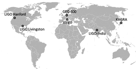
FIG. 4. Carte du futur réseau mondial d'interféromètres.

La communauté scientifique se réjouit de cette découverte. Elle apporte beaucoup de perspectives pour la physique et la recherche. De nombreux interféromètres ayant la même puissance d'observation que ceux d' Advanced LIGO sont en construction, comme VIRGO qui va bientôt être opérationnel (fruit de la coopération franco-italienne et de la collaboration CNRS-INFN) ou encore KAGRA au Japon.