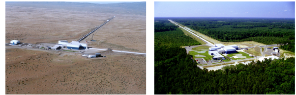
FIG. 2. Photographie des deux interféromètres de l' Advanced LIGO situés à Livingston (à gauche) et à Hanford (à droite).

écouter !) l'Univers d'une toute nouvelle manière.