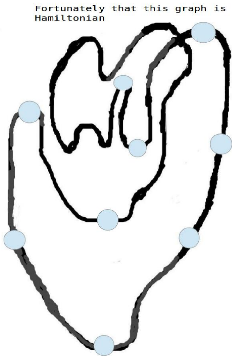
FIGURE 1 – Un graphe hamiltonien : Coeur + artères