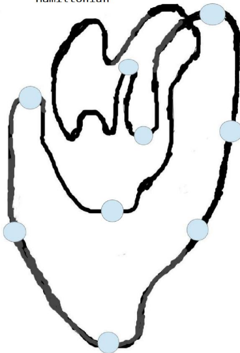
FIGURE 1 – Un graphe hamiltonien : Coeur + artères

Fortunately that this graph is Hamiltonian