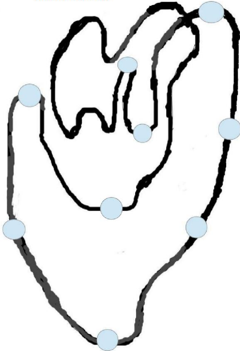
FIGURE 1 – Un graphe hamiltonien : Coeur + artères

Fortunately that this graph is Hamiltonian