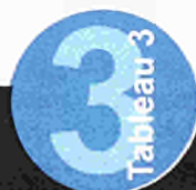
Quelques indicateurs de l'Union européenne en 1996 --Hommes

De plus, l'insertion professionnelle des jeunes ainsi que toute la problématique liée à la transition école/formation - emploi seront vraisemblablement au coeur du (des) programme(s) européen(s) qui succédera(ont) aux programmes Leonardo da Vinci