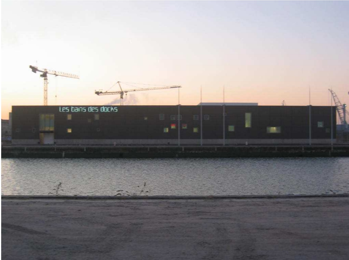
Illustration 1. Façade des Bains des Docks, source personnelle, 2009.