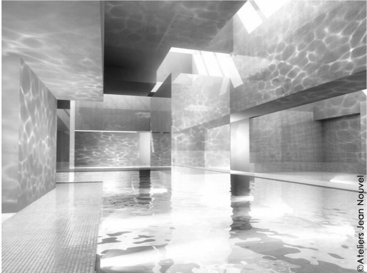
Illustration 2. Image extraite du film d'animation des Bains des Docks illustrant les effets caustiques visibles sur les parois, Ateliers Jean Nouvel, 2004.

Aucun élément de programme ne mentionne une attente quant à l'ambiance souhaitée dans le bâtiment à venir mais, allant au-delà de la demande de la maîtrise d'ouvrage, les Ateliers Jean Nouvel, dès la phase de concours, ont mis l'accent sur deux phénomènes d'ambiances dans le bâtiment projeté : les effets caustiques résultant de la réflexion des rayons lumineux sur les surfaces d'eau en mouvement et les sons émis par les différents remous de l'eau (Illustration 2).