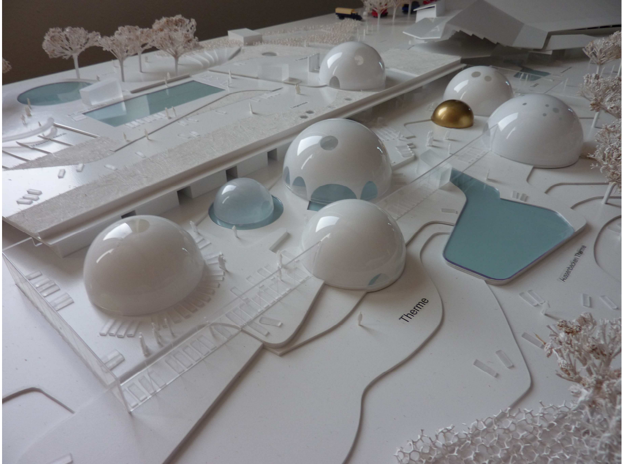
Illustration 5. Maquette des Thermes de Bad Aibling réalisée par Behnisch Architekten en 2003.

Toutefois, à plusieurs reprises, les usagers expliquent leurs déceptions par rapport au manque de sensations ressenties dans les espaces intérieurs : « Dans cette coupole par exemple, je trouve qu'il n'y a pas assez de contraste. Par exemple, ces trous ronds là... et la couleur est jaune claire et il n'y a pas assez de contraste avec ces deux choses. C'est ce que je remarque visuellement. On appelle ça coupole des sens mais il existe beaucoup de sens. Ici, il y a peut être un peu l'oreille qui travaille mais même pas vraiment à fond. Si c'était vraiment une coupole des sens, il faudrait qu'il y ait beaucoup plus de choses par rapport à l'œil, qu'on sente quelque chose, que tout soit plus intensif et là on pourrait dire que c'est une coupole des sens et pas juste une coupole avec de la musique dedans [...] Mais par exemple ici, c'est très intéressant ces jeux de lumière mais pour profiter vraiment de ces jeux de lumière, il faudrait que ce soit plus sombre ici. » (8).