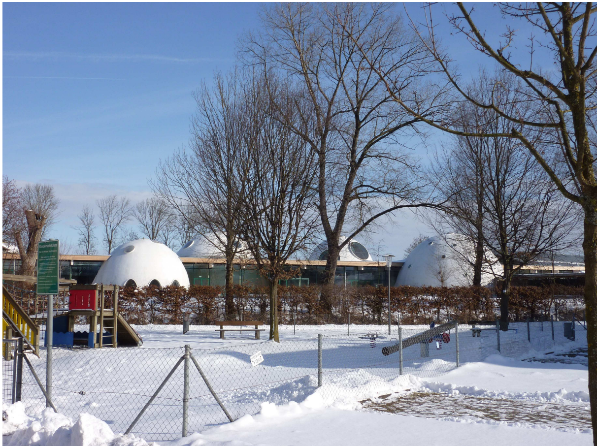
Illustration 4. Façade sud des Thermes de Bad Aibling, source personnelle, 2010.

Les Thermes de Bad Aibling sont situés à proximité du centre-ville historique et offrent une vue privilégiée sur les Alpes Bavaraises visibles grâce au léger dénivelé du terrain qui descend jusqu'aux rives d'un petit cours d'eau, le Triftbach (Illustration 4). L'objectif de la commune par cette nouvelle construction de thermes est d'étendre son périmètre d'attraction en séduisant, par un équipement à la qualité architecturale reconnue, une nouvelle population d'utilisateurs.