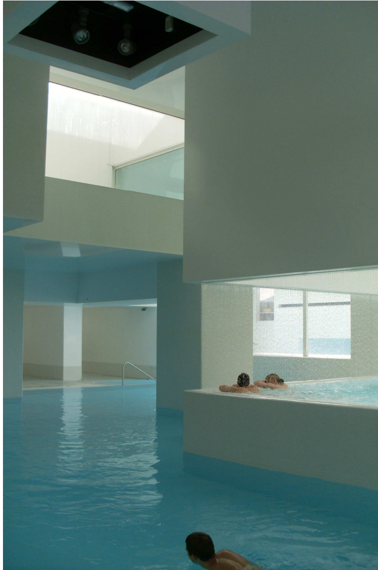
Illustration 3. Vue sur le bassin au rideau d'eau des Bains des Docks, 2010.

par exemple pour conséquence, la mésentente à propos de la mise en eau de bassins situés dans l'entrée du bâtiment. Représentant symboliquement l'eau qui s'infiltré entre les volumes, ces bassins ne sont effectivement plus remplis car inadaptés à la baignade malgré un besoin d'entretien régulier augmentant la charge de travail du personnel (Illustration 3).