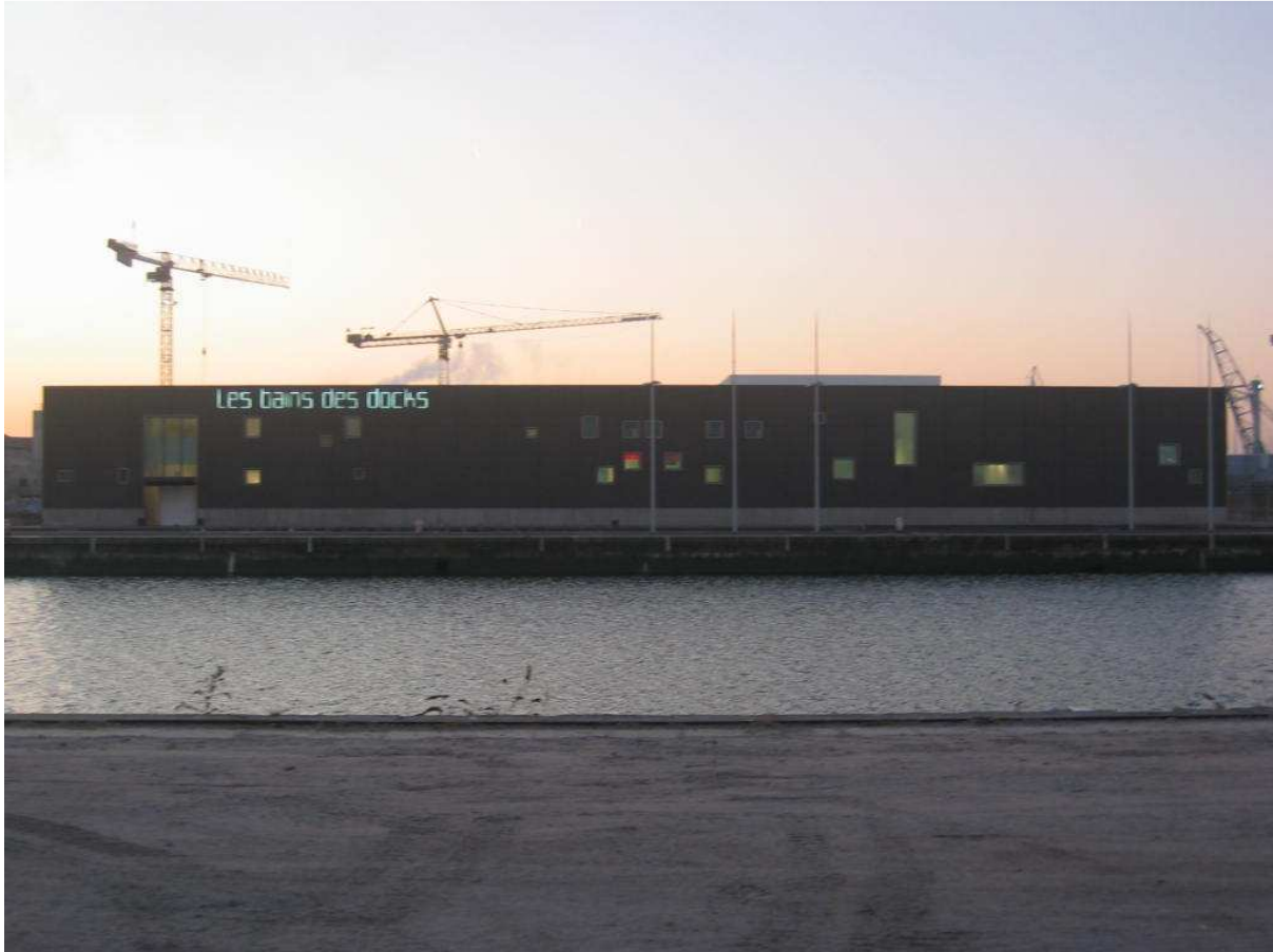
Illustration 1. Façade des Bains des Docks, source personnelle, 2009.