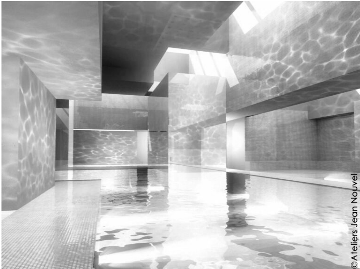
Illustration 2. Image extraite du film d'animation des Bains des Docks illustrant les effets caustiques visibles sur les parois, Ateliers Jean Nouvel, 2004.

Aucun élément de programme ne mentionne une attente quant à l'ambiance souhaitée dans le bâtiment à venir mais, allant au-delà de la demande de la maîtrise d'ouvrage, les Ateliers Jean Nouvel, dès la phase de concours, ont mis l'accent sur deux phénomènes d'ambiances dans le bâtiment projeté : les effets caustiques résultant de la réflexion des rayons lumineux sur les surfaces d'eau en mouvement et les sons émis par les différents remous de l'eau (Illustration 2).