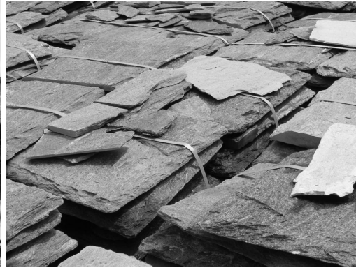
2. photographie des pierres prêtes à l'export. La proximité du site d'extraction du gneiss a été une des raisons pour lesquelles l'architecte a choisi d'utiliser cette pierre dans son édifice (Vals, Suisse, juillet 2007).

Dès la phase de concours des Bains des Docks, les Ateliers Jean Nouvel (AJN) ont mis l'accent sur deux phénomènes d'ambiances principalement : le contrôle des sons dans le bâtiment et les effets lumineux. Les planches de concours présentant des images issues des outils numériques mettent en avant des effets lumineux – les effets caustiques – qui résultent de la réflexion des rayons lumineux sur la surface de l'eau ( ill. n°3 ). Par ailleurs, ils sont décrits dans la notice architecturale qui accompagne les panneaux de concours :