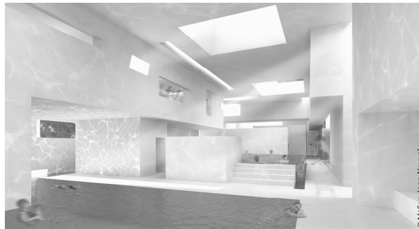
3. image numérique, vue sur l'espace balnéothérapie. Source : image extraite du panneau n°06 pour le concours international du Centre de la Mer et du Développement Durable et du complexe aquatique du Havre, Avril 2004, AJN.

Les espaces évoluent au rythme des variations séquentielles de la lumière naturelle. [...] Le clapot de l'eau se réfléchit sur les glacis des parois et des plafonds, et ses images multiples se mélangent parfois à des images projetées sur les mêmes parois et plafonds. [...] Il s'agit bien d'un jeu d'ombres et de lumière qui est mis en place, ce jeu étant amplifié mais aussi diffracté par les multiples surfaces réfléchissantes qui sont l'essence même de ce lieu.