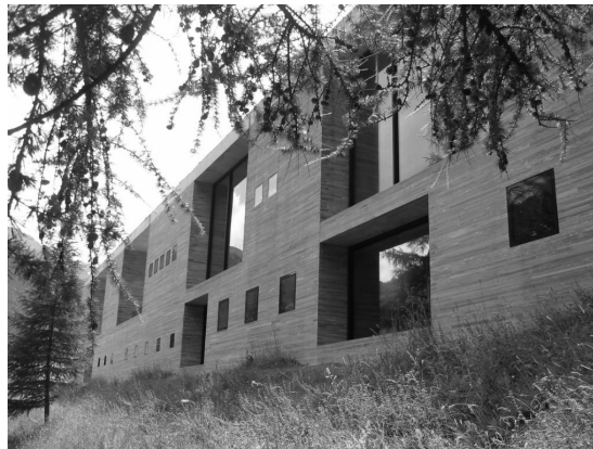
4. photographie de la façade principale des Thermes de Vals. Par de légères failles apparentes en toiture, le système constructif des thermes sous forme de blocs distincts peut être deviné (Vals, Suisse, juillet 2007).

Les différents espaces de baignade en forme de blocs de pierre qui interpellent les différents sens ont chacun fait l'objet de représentations iconographiques et langagières. Ainsi, pour le bain de feu et le bain de glace, des représentations colorées en rouge et bleu figurent les contrastes de température 13 . Ces couleurs se retrouvent dans le bâtiment construit sous forme de pigments qui colorent le béton à l'intérieur des blocs de pierre ( ill. n°4 ).