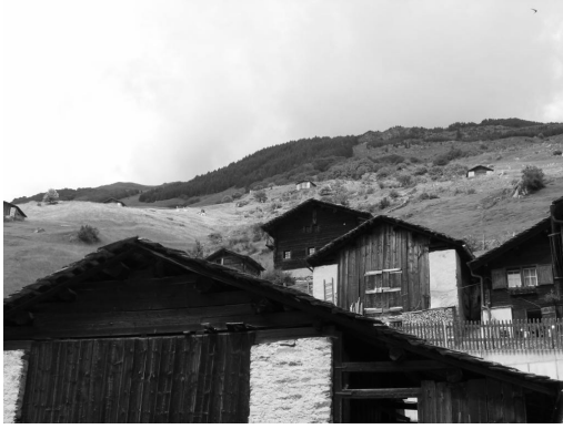
1. photographie des constructions typiques de la commune de Vals. Le gneiss est traditionnellement utilisé comme élément de couverture (Vals, Suisse, juillet 2007).