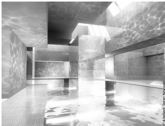
5. image extraite du film d'animation des Bains des Docks, AJN, 2004.

Par ailleurs, les AJN ont recours à d'autres modes de représentation des ambiances lors de la phase d'étude du bâtiment. Ils évaluent par exemple le phénomène lumineux par des simulations numériques afin de prévoir le plus précisément possible les ambiances réelles dans le bâtiment construit (ill. n°6).