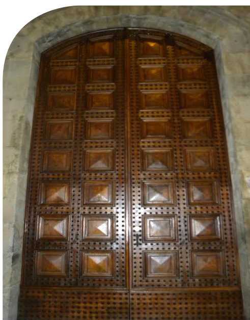
La porte du palais Spini-Feroni

Le cas fait état des origines de la maison en une seule phrase : « Salvatore Ferragamo [Società per Azioni], was a Florence-based maker of high-quality Italian clothing and leather goods, which began as the small, handmade shoe business of Salvatore Ferragamo (see Appendix A) » (Harvard Business School, 1998, p. 145). L'histoire est un peu plus développée dans ledit Appendix A : les débuts de Salvatore, encore enfant, en Italie, le développement de ses créations et de sa renommée à partir du microcosme hollywoodien dans les années 1920, son retour à Florence pour développer une production soutenue mais artisanale grâce au savoir-faire d'employés italiens, sa créativité associée à un confort légendaire reposant sur des études d'anatomie.