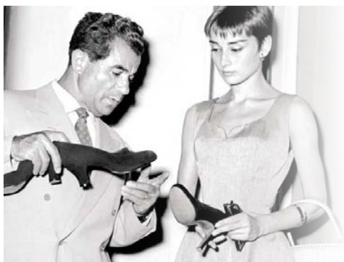
Audrey Hepburn et Salvatore Ferragamo