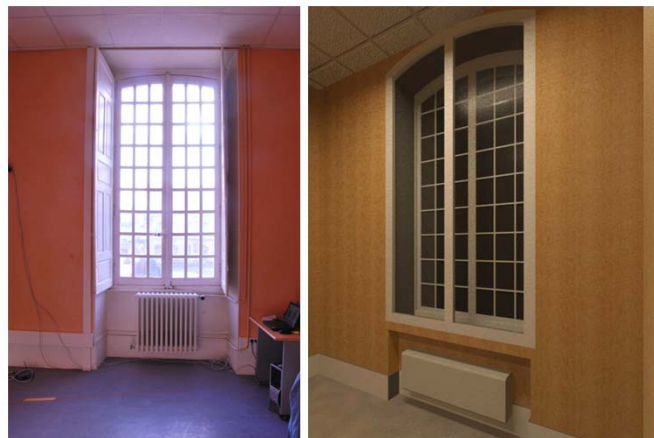
Figure 1. Configurations actuelle et après rénovation

L'école d'ingénieur Arts et Métiers Paris Tech, centre de Cluny, occupe les bâtiments de l'ancienne abbaye clunisienne. Datant du dix-huitième siècle, les locaux souffrent d'une isolation thermique déplorable. La facture énergétique annuelle atteint la centaine de milliers d'euros. Nos investigations ont consisté à proposer un scénario de rénovation d'une des centaines de grandes fenêtres d'époque. On interpolera par la suite sur l'ensemble. Parmi les hypothèses envisageables (survitrage, remplacement de la baie,...) il fut préconisé d'opter pour la double peau: La baie actuelle est conservée, préservant l'esthétique extérieure du monument. La configuration intérieure du bâtiment est adaptée à l'ajout d'une cloison surmontée d'une nouvelle baie. Ce concept est préconisé dans le cadre d'une isolation par l'intérieur d'un bâtiment [Hovig ter Minsassian, 2011]. Il a démontré son efficacité, devenant pratique courante notamment dans les pays nordiques. : La figure 1 montre la configuration actuelle ainsi qu'une projection de cette configuration, après travaux.