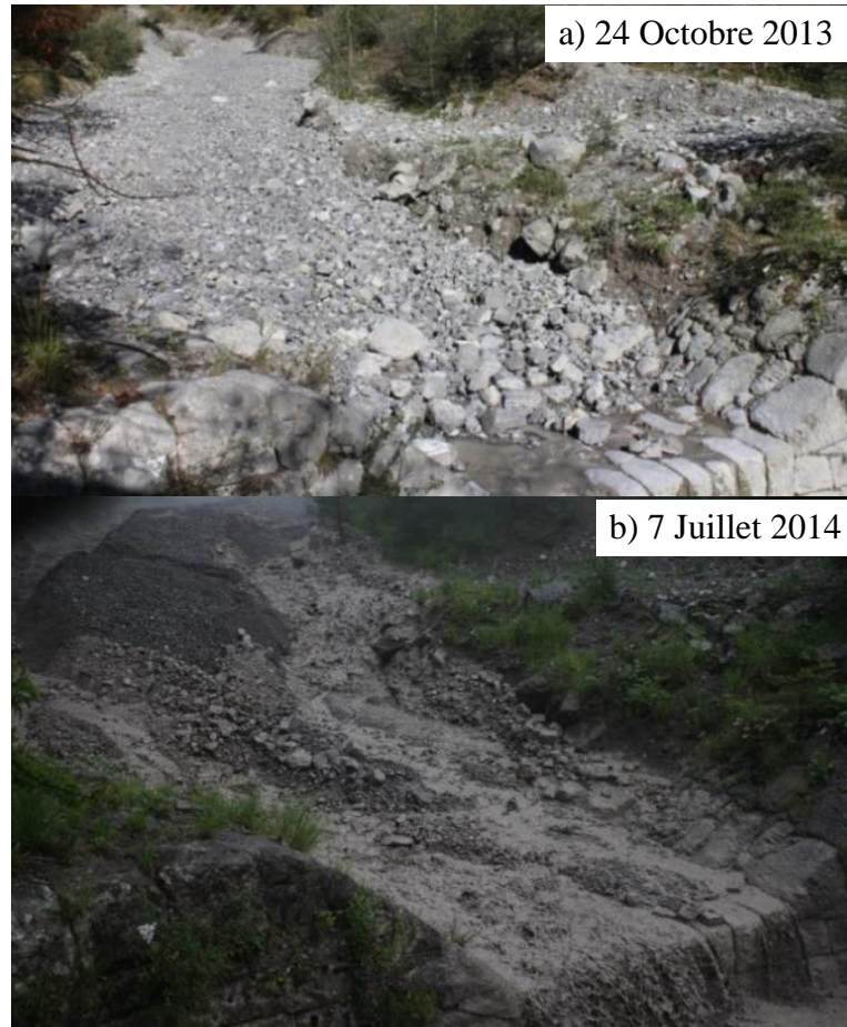
Figure 2: Photos comparatives d'un barrage sur le Manival (38, France): a) 24/10/2013 : forte accumulation à la suite d'une crue, faciès lisse d'aggradation, b) 7/7/2014 : ré-érosion du dépôt par incision d'un chenal