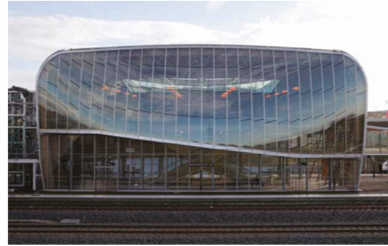
La gare Tgv de Belfort-Montbéliard associe technologie et nature.

Ce concept de performance environnementale des bâtiments-voyageurs a été abordé aussi en France et notamment au moment du réaménagement de la gare d'Archères-Ville, dans les Yvelines, entre 2008 et 2009. La rénovation du bâtiment principal a été définie comme un véritable « laboratoire pour le développement du concept de gare à Haute qualité environnementale (HQE) ». Ceci a permis de pallier l'absence de confort des espaces destinés aux voyageurs, de réorganiser les flux (personnel et voyageurs), de mettre en conformité son accessibilité, et aussi de diminuer sa consommation énergétique. Des cellules photovoltaïques, des panneaux solaires, des pièges à chaleur, une centrale géothermique et un système de récupération des eaux de pluie sont ins-