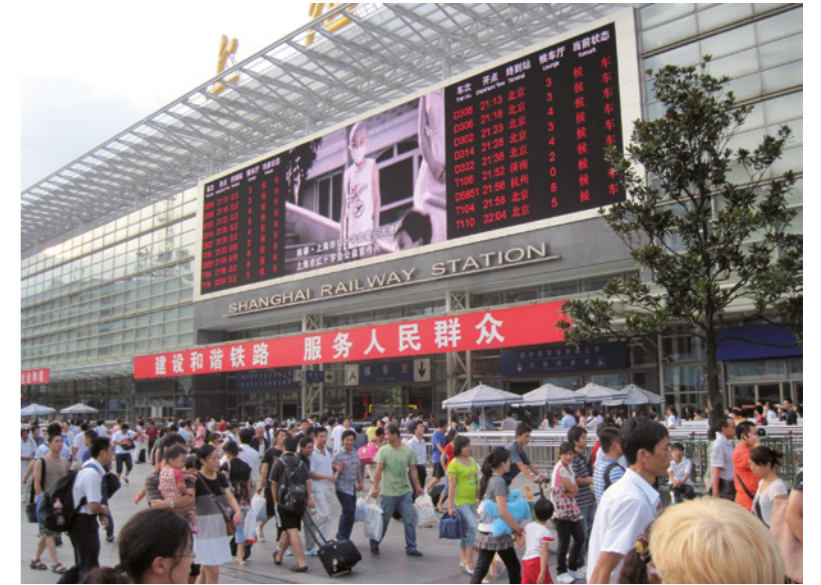
La gare centrale de Shanghai, nœud incontournable du réseau ferroviaire entre le nord et le sud de la Chine.

1842 : après une cuisante défaite face aux armées britanniques, la Chine impériale se voit contrainte, à ouvrir ses portes et cinq de ses ports au commerce avec l'Europe. Dans la brèche ainsi ouverte, des idées nouvelles vont faire leur chemin et venir ébranler la stabilité millénaire de l'Empire du milieu. Et dans ce pays qui se réveille et qui s'agit, une ville va briller plus que les autres. Cette ville, c'est Shanghai, le « Paris de l'Orient », enclave coloniale capitaliste sous contrôle occidental en plein territoire chinois. L'Empire laisse la place à la République nationaliste. Un contexte politique, industriel, économique et démographique va alors amener la ville à connaître un développement phénoménal en quelques décennies à peine pour devenir, dès les années 1920, la métropole fantasmée que l'on connaît, allant même jusqu'à être équipée de deux gares : une au nord, terminus des trains en direction des capitales impériale (Pékin) puis républicaine (Nankin) ; une autre au sud, en direction de l'enclave