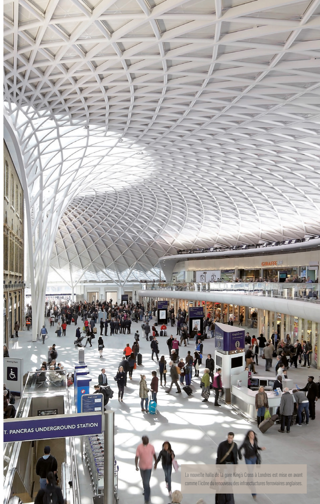
La nouvelle halle de la gare King's Cross à Londres est mise en avant comme l'icône du renouveau des infrastructures ferroviaires anglaises.