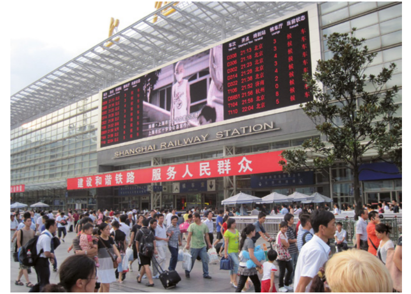
La gare centrale de Shanghai, nœud incontournable du réseau ferroviaire entre le nord et le sud de la Chine.

1842 : après une cuisante défaite face aux armées britanniques, la Chine impériale se voit contrainte, à ouvrir ses portes et cinq de ses ports au commerce avec l'Europe. Dans la brèche ainsi ouverte, des idées nouvelles vont faire leur chemin et venir ébranler la stabilité millénaire de l'Empire du milieu. Et dans ce pays qui se réveille et qui s'agite, une ville va briller plus que les autres. Cette ville, c'est Shanghai, le « Paris de l'Orient », enclave coloniale capitaliste sous contrôle occidental en plein territoire chinois. L'Empire laisse la place à la République nationaliste. Un contexte politique, industriel, économique et démographique va alors amener la ville à connaître un développement phénoménal en quelques décennies à peine pour devenir, dès les années 1920, la métropole fantasmée que l'on connaît, allant même jusqu'à être équipée de deux gares : une au nord, terminus des trains en direction des capitales impériale (Pékin) puis républicaine (Nankin) ; une autre au sud, en direction de l'enclave