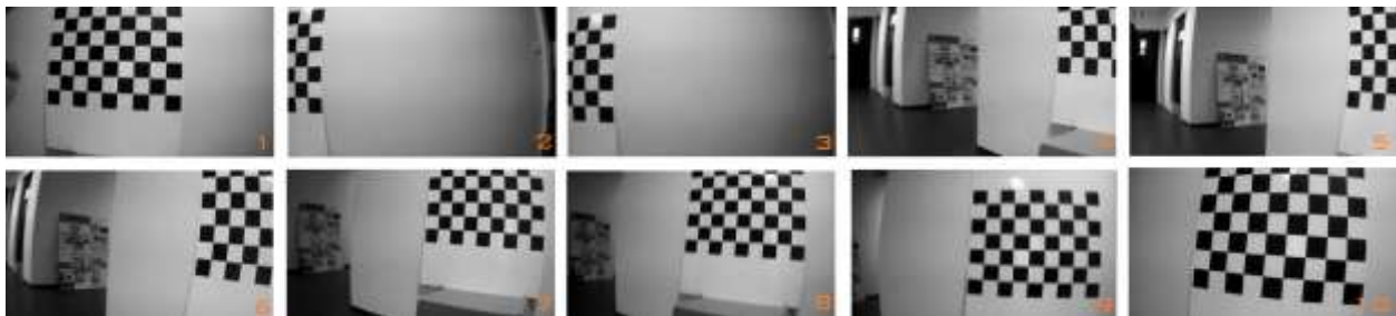
Figura 2. Estabilización visual

La aplicación del control visual se llevó a cabo en un lugar cerrado y con suficiente iluminación donde las corrientes de aire era pequeñas. La Figura 2 muestra las imágenes tomadas por el UAV mientras realizaba el control visual desplazándose lateralmente hasta obtener la imagen deseada (primera imagen).