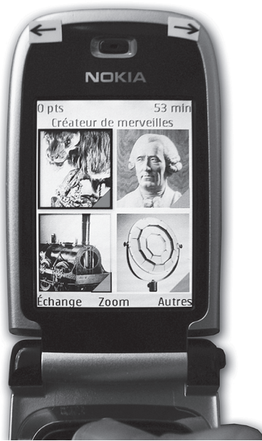
Illustration II Exemple de cartes virtuelles représentant les objets du musée..

L'originalité du jeu est de faire accéder les visiteurs à des représentations numériques des objets par des déplacements physiques dans l'espace du musée. L'objectif affiché de PLUG/les secrets du musée est ainsi de permettre au visiteur de produire de nouveaux liens signifiants entre les différents objets et d'interroger l'organisation du musée en sept grands domaines thématiques – instruments scientifiques, matériaux, construction, communication, énergie, mécanique, transport. Pour concevoir et réaliser ce jeu, les acteurs du projet ont dû se donner les moyens d'une convergence.