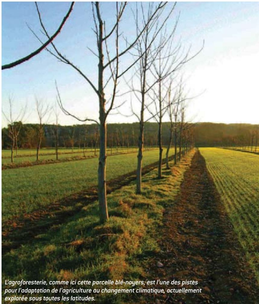
L'agroforesterie, comme ici cette parcelle blé-noyers, est l'une des pistes pour l'adaptation de l'agriculture au changement climatique, actuellement explorée sous toutes les latitudes.