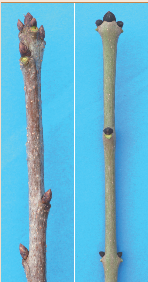
Figure 1 : axes terminaux de merisier à gauche et de frêne à droite.