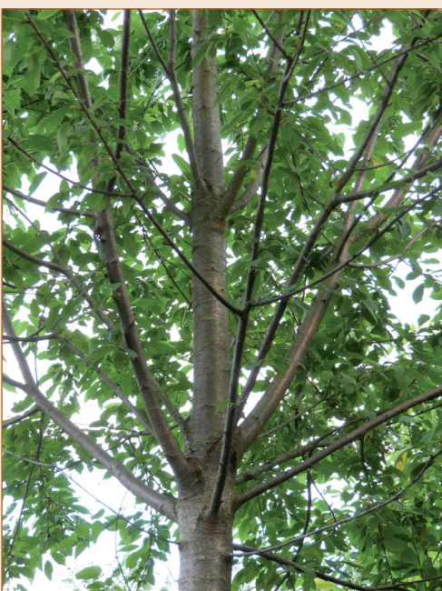
Figure 2 : les deux types de couronnes de branches sur un même merisier. Couronne inférieure formée de 11 branches insérées sur 25 cm environ et couronne supérieure formée de 4 branches insérées presque au même niveau.