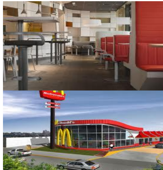
Design Restaurant McDonald's