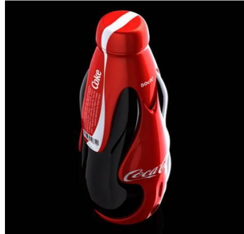
Design Bouteille Coca Cola