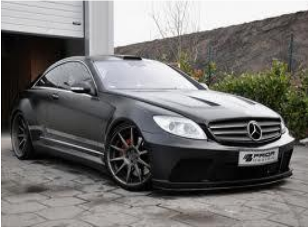
Design Automobile Mercedes