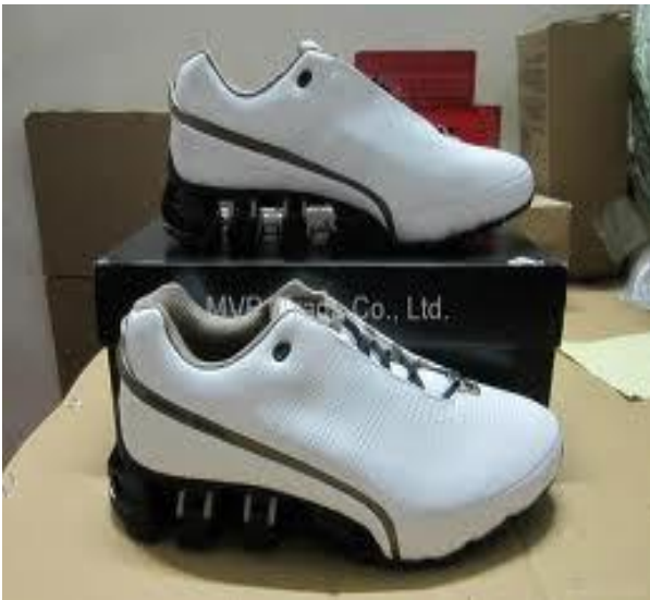
Design Chaussure Adidas