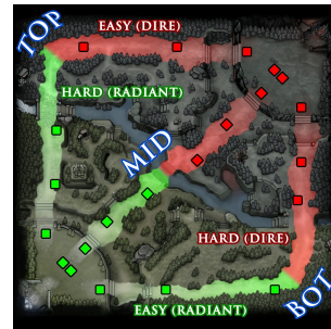
FIG. 2 – Terrain de Dota2

Une partie est jouée sur un terrain de jeu où deux équipes de cinq joueurs s'affrontent en temps réel. Chaque équipe doit défendre son château et détruire celui de l'opposant pour gagner. Chaque joueur contrôle un héros qu'il peut déplacer sur le terrain (contrôle souris/clavier) et doit entraîner en collectant de l'argent, de nouveaux objets, des compétences et en se battant contre les forces ennemies. La Figure 2 présente les zones d'influence initiales des deux équipes. L'équipe rouge appelée the dire (resp. verte pour the radiant ) défend son château situé au coin bas-gauche (resp. coin haut-droit). Trois "chemins" principaux ( top , mid , bot ) séparent les équipes et contiennent des tours défensives. Chaque joueur a un rôle bien défini, qui dépend du héros qu'il a choisi (parmi 110 héros). Par exemple, un rôle consiste à défendre et étendre la zone d'influence sur un chemin spécifique ; un autre est de changer souvent de chemin pour rejoindre un allié et attaquer un ennemi par surprise. Sachant qu'une équipe ne peut voir que les zones qu'elle contrôle et donc estimer la position des ennemis, le fait de déclencher des attaques synchronisées est la clef du succès, tout en sachant garder son rôle initial sans quoi la progression du héros (amélioration de ses capacités) est beaucoup plus lente.