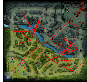
FIG. 3 – Modèle G_{darkseer}

On part du principe qu'ayant une base de traces de mouvements assez conséquente pour un héros/rôle particulier, le comportement moyen devrait présenter la normalité, i.e. les zones qu'il doit contrôler. En décrivant les traces par un ensemble de propriétés qui dénotent des éléments de stratégies, on suppose que les descriptions d'anomalies seront des stratégies qui sont inefficaces, générées par les joueurs en phase d'apprentissage. Un tel exemple de graphe moyen (construit comme expliqué en Section 2) est donné par la Figure 3 pour le héros Dark Seer à partir de 500 traces de jeux issues du site http://dotabank.com/ . Le motif décrira donc les erreurs stratégiques, erreurs d'autant plus fortes que l'est la mesure d'anomalie, et le support indiquera classiquement la fréquence d'apparition de cette anomalie.