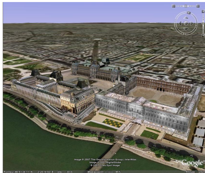
Figure 1 : Musée du Louvre en 3D

Modèles Numérique de Terrain (MNT), de Surface (MNS) ou d'Élévation (MNE) ; modèles 3D avec surfaces et volumes. Le développement très rapide et grand public du rendu virtuel de villes en 3D, avec par exemple Virtual Earth (Microsoft) [Web VirtualEarth], le Géoportail (IGN) [Web Géoportail] ou Google Earth (Figure 1) [Web GoogleEarth], en a démontré l'intérêt. On peut également citer d'autres applications des SIG, trouvant un avantage à l'information 3D : aménagement urbain, architecture et planification urbaine, voirie, génie civil ; choix de tracés routiers ou ferroviaires, transport ; protection civile ; protection environnementale, gestion de ressources naturelles (les forêts par exemple), géologie ; guidage et localisation par systèmes de navigation personnels (automobilistes) ou directement sur téléphone mobile (piétons) ; applications militaires ; simulation, jeux virtuels ; tourisme virtuel.