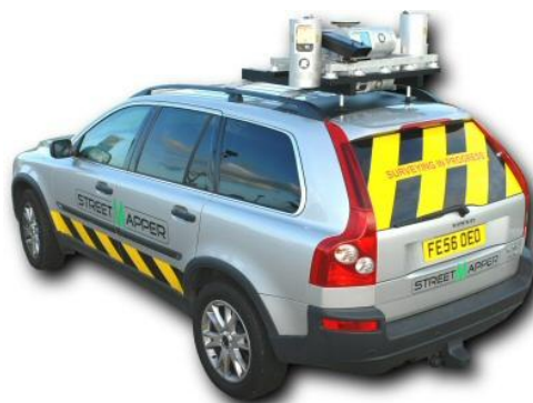
Figure 3 : StreetMapper (3DLM) – exemple de système commercial

Nous développons depuis 2002 une plateforme expérimentale de Système Mobile de Cartographie appelée LARA-3D [GOU06]. Il s'agit d'une plateforme d'étude et d'appui aux travaux scientifiques, ayant déjà connu plusieurs versions, et qui effectue notamment des relevés laser du type « On-Drive ». La Figure 2 présente une illustration du principe de relevé laser par système mobile, avec le prototype LARA-3D (version 2008). Les points 3D couleur sont des points relevés par le scanner laser, et colorisés par des caméras [DES09]. Ces données sont ici superposées à un Modèle Numérique de Surface (MNS) obtenu par des prises de vue aériennes, fourni par l'IGN (points gris). L'approche choisie pour notre plateforme, qui en fait son originalité et son intérêt, repose sur les points suivants : il s'agit d'une part d'un système intégré d'acquisition et de traitement de données « temps réel » ; d'autre part, d'un système générique par rapport aux applications, à la fois urbaines et routières et déclinées avec différentes variantes ; enfin, nous cherchons à avoir un système « bas coût », ayant choisi d'une part de conserver des capteurs de localisation de moyenne gamme, et d'autre part compte tenu de l'approche intégrée et temps réel.