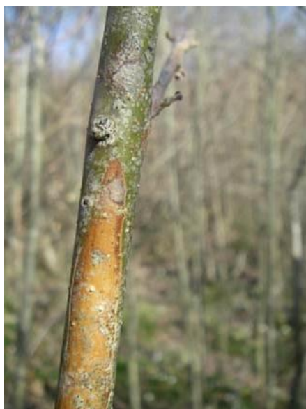
Figure 1: necrotic stem lesions on ash