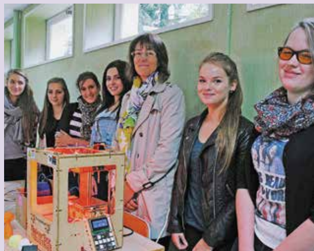
Figure 2 : Opération « Sciences de l'Ingénieur au Féminin », lycée La Pérouse-Kerichen, Brest, novembre 2014.

Les associations, les établissements d'enseignement et de recherche, les entreprises, l'Etat mettent en place une diversité d'actions en faveur de la mixité des métiers, et en particulier de la féminisation des filières scientifiques. Tous les acteurs doivent se mobiliser. Il serait illusoire de croire qu'un simple changement d'attitude des femmes elles-mêmes suffirait à lui seul pour résoudre les déséquilibres.