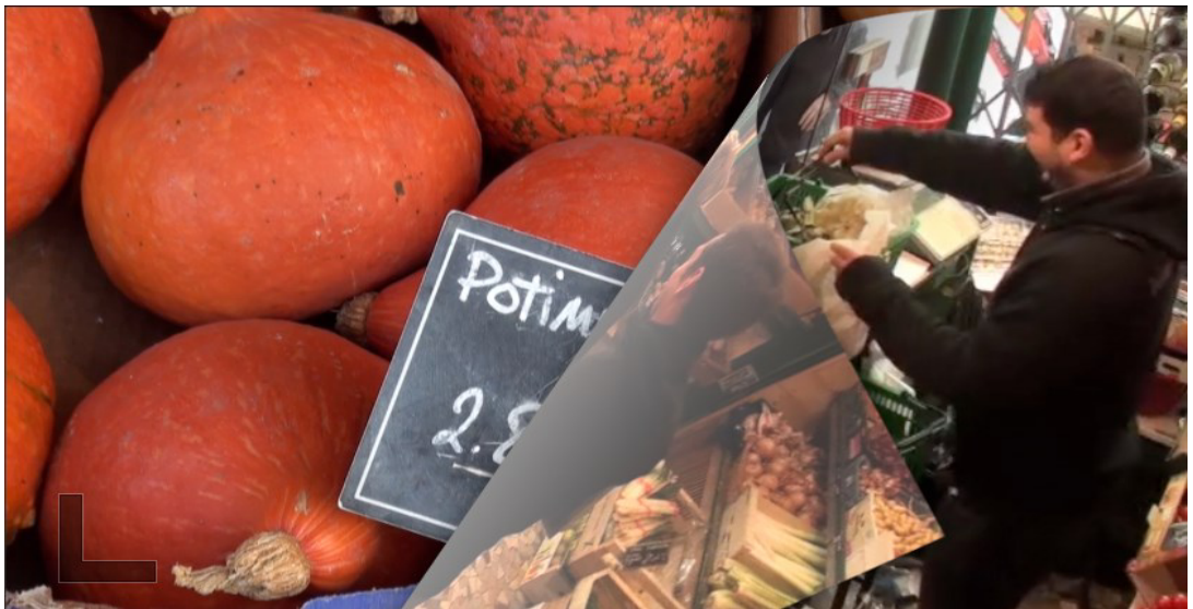
Image 2. Effet de transition entre deux séquences.