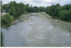
Le Loiret envasé (Orléans)