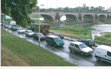
Des boulevards contre la proximité de la Loire