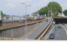
Saignées routières en bord de Maine