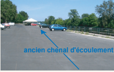
Dalle sur le canal latéral (Orléans)