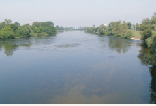
Les rives du Cher oubliées (Tours)