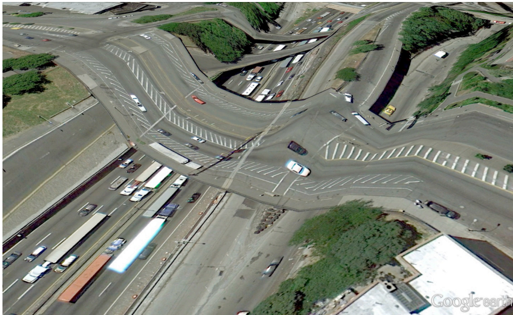
Figure 3 : Capture d'écran de Google Earth. Disponible sur : http://www.postcards-from-google-earth.com/bronx1/ . Dernière consultation le 11/11/2015

L'analyse des interfaces a permis de mettre en évidence la marginalisation graphique et donc symbolique de l'action de la machine. Elle a également eu pour effet de perturber la circulation auto-entretenu de l'anthropocentrisme ordinaire, partant de rendre possible une prise en compte du mode d'existence des machines computationnelles. Reste alors à le qualifier positivement : qu'est-ce que l'agir computationnel ? Afin d'en proposer une première esquisse, nous avons sélectionné un exemple particulièrement fertile pour mettre à l'épreuve le regard que nous portons sur la machine et son action.