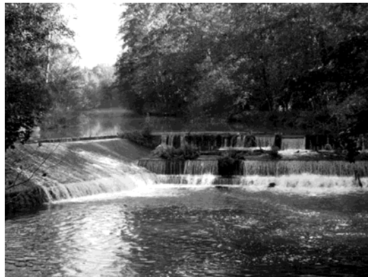
Photo 2. Vannage sur le Grand Morin, La Ferté Gaucher