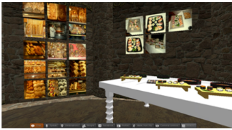
Figure 3 - Cuisines du monde