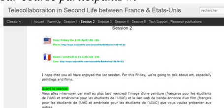
Figure 1 - Une capture d'écran du blog

Les dates et les horaires des séances ont été fixés sur Doodle 4 et un blog bilingue 5 (cf. figure 1) a été mis en place afin de guider les participants tout au long du projet. Dans ce blog, les apprenants peuvent consulter les horaires et les indications pour préparer chaque séance, ils peuvent également trouver des soutiens techniques sur l'utilisation de SL. Selon Deutschmann & Panichi (2009 : 31) « giving clear instructions prior to the course was of key importance, especially as we were teaching exclusively on-line with no physical contact with our course participants ».