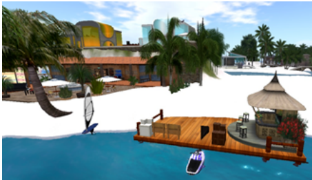
Figure 4 - Activités nautiques

Les séances sont conçues, de façon à mettre en valeur les décors marqués culturellement dans SL, pour favoriser les échanges et les interactions des participants dans les deux langues cibles. Comme l'évoqué Sadler (2012: 125), « the goal of this sort of exchange [telecollaboration] is not necessarily to enhance the grammatical knowledge of the participants (although that certainly may happen), but instead to enhance the ability of an individual "[...] to interact effectively with people from cultures that we recognize as being different from our own" (Guilherme, 2000: 297). The end goal is to create speakers who are competent in intercultural communication ».