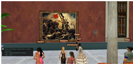
Figure 5 - Galerie d'art

Ce genre de présentation est plus intéressante, plus ludique que dans une classe. Il y a tout un univers autour, on a l'impression de présenter une œuvre immense dans un musée. C'est vraiment bien. On met un peu en scène nos présentations.