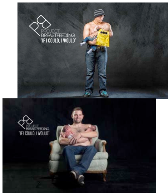
Figure 5. Project breastfeeding

D'une part, la campagne Project breastfeeding (figure 5), surfant sur l'univers symbolique de l'allaitement, valorise de manière connotée le rôle de la mère via le slogan, « If i could, I would » faisant écho au courant de féminisme différentialiste. D'autre part, ces affiches illustrent le lien entre père et bébé qui se tisse avec des hommes heureux et puissants, bousculant ainsi la représentation dominante de l'homme « macho qui cache ces émotions ». Le message du renversement des rôles sociaux accentue le rôle central de l'homme dans ce qu'on appelle couramment « le projet d'allaitement » symbolisé par le logo. L'allaitement ne peut être une pratique isolée et isolante.