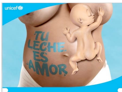
Figure 4. Tu leche es amor

Dans Breast milk is best for your baby appelée aussi Latch in NYC (image 3), la dimension figurative et discursive est prégnante. Elle apparaît à travers un bébé joufflu visiblement couché sur un matelas. Pas de mère mais pour palier à cela, le lait est imagé sous forme de goutte et le mot « milk » en blanc est itératif dans l'affiche. Le discours est négatif, il ne mentionne pas les bienfaits pour l'enfant ou pour la mère mais la baisse des risques encourus, en sous-entendu avec le lait artificiel. On valorise essentiellement le lait et ses effets par le registre figuratif analytique. Le discours se focalise sur l'objet, le bébé est une icône à lui seul.