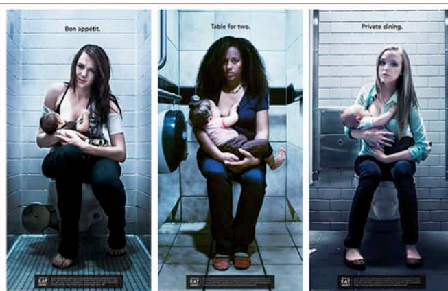
Figure 1. Would you eat here ?

Une image d'Épinal de l'allaitement se caractérise par une polarisation sur l'objet substantiel « sein » (fond blanc/clair, peu de place au cadre, gros plan sur le bébé qui a le sein dans la bouche ou mise en scène de la mère allaitante yeux dans les yeux avec son bébé et mise en valeur esthétique de ses attributs nourriciers) réduisant ainsi le sens de l'allaitement à sa fonction nourricière et produisant des images iconiques de la femme-objet. On a longtemps trouvé ce type d'image sur les brochures d'information émanant des institutions médicales et paramédicales. Elle reste une représentation dominante véhiculée par les médias. D'un côté, femme-objet réduite à la production de lait que l'on associe au réseau sémantique de l'industrie laitière, le terme de « vache laitière » qualifiant parfois certaines femmes ou certaines pratiques (utilisation du tire-lait). De l'autre, femme-objet avec une banalisation du sein érotique, en témoigne le récent engouement médiatique pour le bref retrait de « la page 3 » du journal britannique le Sun « avec les filles aux seins nus ». En même temps, des mouvements de réappropriation du corps de la femme se développent, une mobilisation particulièrement visible sur les réseaux sociaux, ce qu'illustre le mouvement « Free the nipple » ou encore les « brelfies » pour défendre l'allaitement en public.