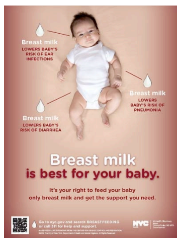
Figure 3. Breast milk is best for your baby

L'affiche Breastfeeding is not just for newborns (figure 2), est emblématique de la sémiologie du lien mère-enfant avec le choix des vêtements identiques, d'une tonalité de bleus, d'une même coupe de cheveu : un allaitement qui illustre les liens d'attachements mais qui rompt avec le discours social et culturel sur l'allaitement. On montre une autre position d'allaitement que celle de « la madone ». La mère ne regarde plus son enfant. Elle nous regarde d'un air confiant. L'enfant doit avoir dans les deux/trois ans, âge à partir duquel on commence à parler du sevrage naturel. Il y a peu de place au cadre situationnel mais une mère et son fils, rompant ainsi avec la théorie freudienne de l'Œdipe et illustrant plutôt la théorie de l'attachement de John Bowlby.