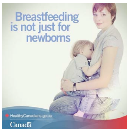
Figure 2. Breastfeeding is not just for newborns

L'affiche Breastfeeding is not just for newborns (figure 2), est emblématique de la sémiologie du lien mère-enfant avec le choix des vêtements identiques, d'une tonalité de bleus, d'une même coupe de cheveu : un allaitement qui illustre les liens d'attachements mais qui rompt avec le discours social et culturel sur l'allaitement. On montre une autre position d'allaitement que celle de « la madone ». La mère ne regarde plus son enfant. Elle nous regarde d'un air confiant. L'enfant doit avoir dans les deux/trois ans, âge à partir duquel on commence à parler du sevrage naturel. Il y a peu de place au cadre situationnel mais une mère et son fils, rompant ainsi avec la théorie freudienne de l'Œdipe et illustrant plutôt la théorie de l'attachement de John Bowlby.