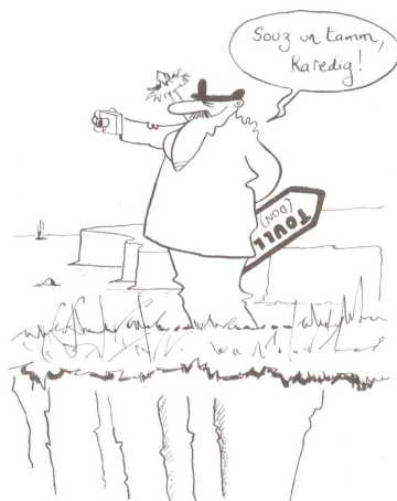
PROBLEME : c'est un mot utilisé à toutes les sauces en français. Kaout an dizober eus mell bec'h...

Pajenn 121 e weler ur paotr a ziskouezh implij ur benveg luc'hskeudenniñ war vord ar mor, hag a lavar da unan bennak ha ne weler ket : «Souz un tamm, karedig». O c'hoarzhiñ emañ ar paotr, laouen, hag eñ o kuzhat ur skritell a lavar «toull (don) ». Diouzh ul lennadenn hetero, ez eus neuze ur vaouez ouzhpenn da gontañ. Resisoc'h vefe neuze kontañ evit al levr a-bezh ur vaouezh o kanañ “Jezuz pegen bras eo”, div o tevel hag unan all a zo o paouez bezañ lazhet gant unan a ra “karedig” anezhi. Merc'hed yaouank c'hoant bras ganeoc'h komz ha deskiñ ar yezh, setu ar plas e vo dav deoc'h ober ho mad gantañ? Bruderezh al levr a embann fraezh: “Le guide du bretonnant propose, non sans humour , un regard sur la langue bretonne différent des autres ouvrages”.