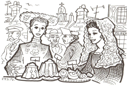
chez le marchand

1. C'est votre tour maintenant, je crois. Que voulez-vous? — 72