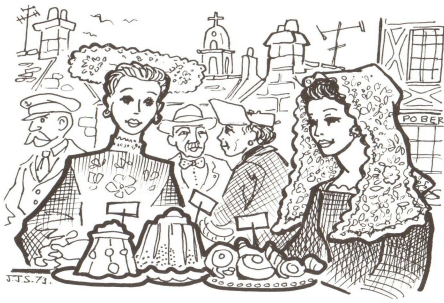
chez le marchand

1. C'est votre tour maintenant, je crois. Que voulez-vous? — 72